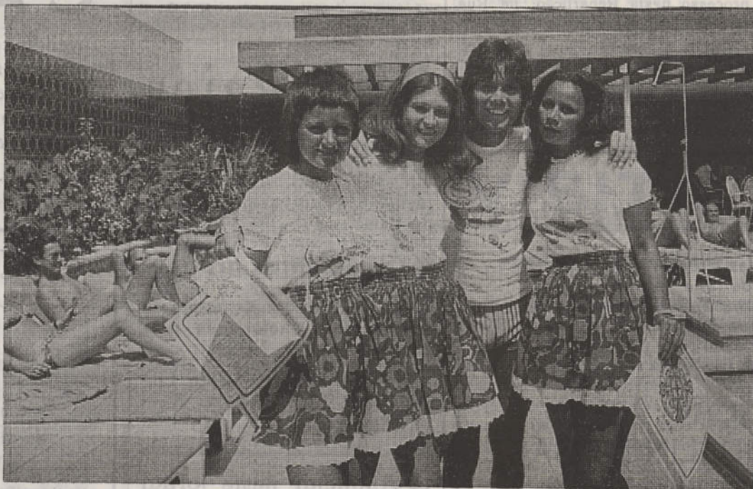
Popularidade (feminina), linguagem universal para Cliff

— Vou para lá descansar, em busca do mar e do sol... E de facto, assim acontece. Cliff é já um hóspede habitual da cosmopolita Albufeira, onde as gentes colaboram, admirando a personalidade invulgar do popular artista. Talvez, por isso, Cliff Richard diga, encantado do povo português: — É o mais agradável do mundo! Comunicativo, sensível, hospitaleiro. Faz gala de bem receber. Exemplar! Obrigado, Cliff.