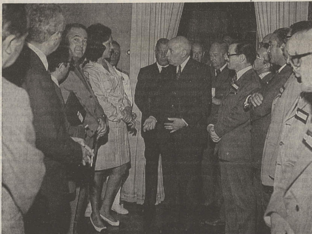
Um aspecto da audiência do Chefe do Estado, na Sala Luís XV

Ao serviço da Pátria e afim de «ver terras de todos nós» seguiu para o Estado de Angola um batallhão de jornalistas constituído por representantes de 170 órgãos de informação de todas as regiões do espaço metropolitano e insular.