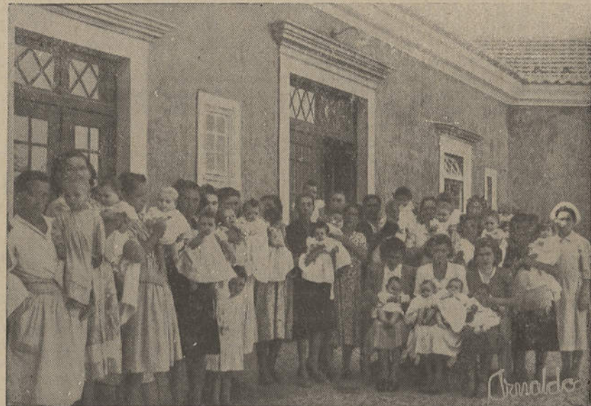
Um numeroso grupo de crianças assistidas pelo lactário do Refúgio

ELEBRA-SE hoje a tradicional festa do Refúgio Aboim Ascensão, que tem desenvolvido uma obra humana e social do mais alto alcance.