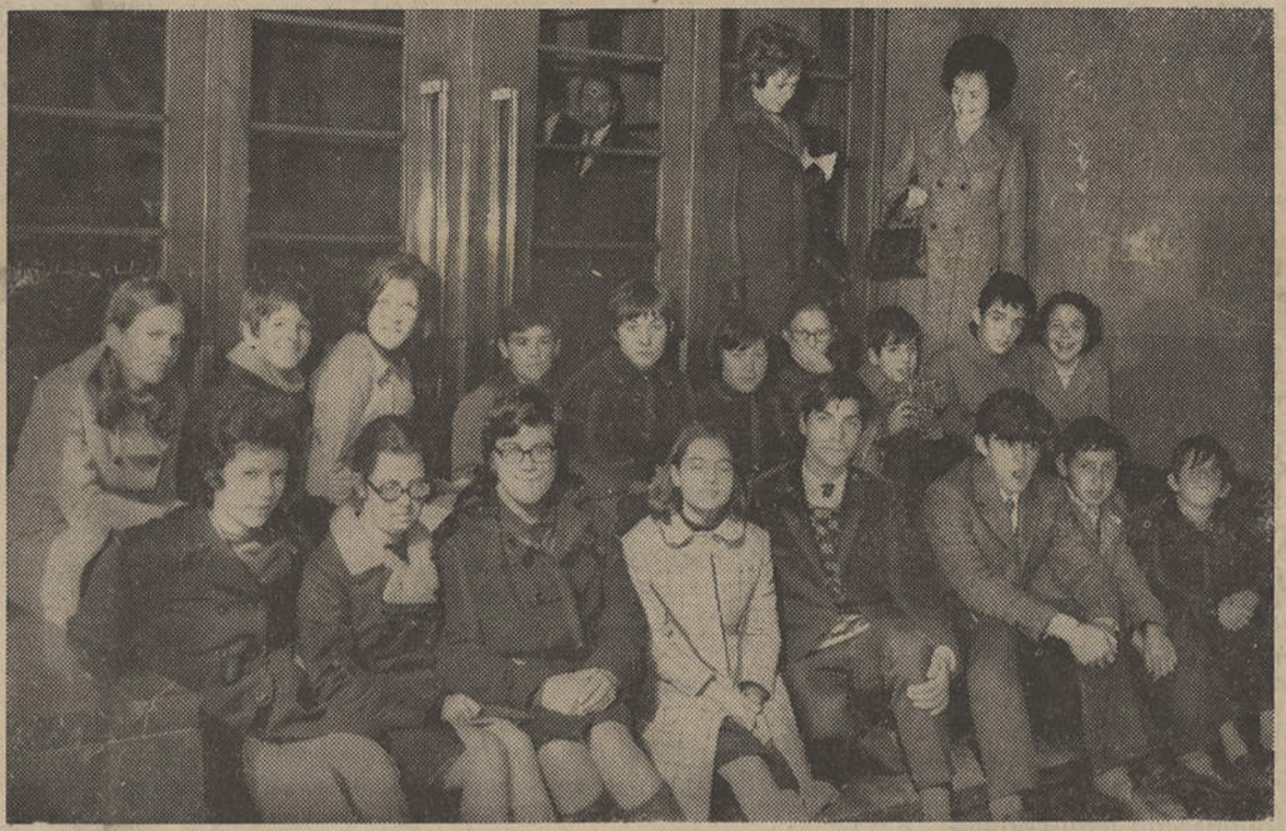
Acompanhados das suas professoras estiveram no «Diário de Notícias» alguns alunos do ensino secundário que ficaram a saber como se faz um grande diário