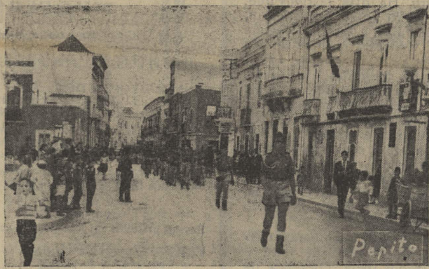
A «Bandeira» da M. P. desfilando numa das ruas desta cidade