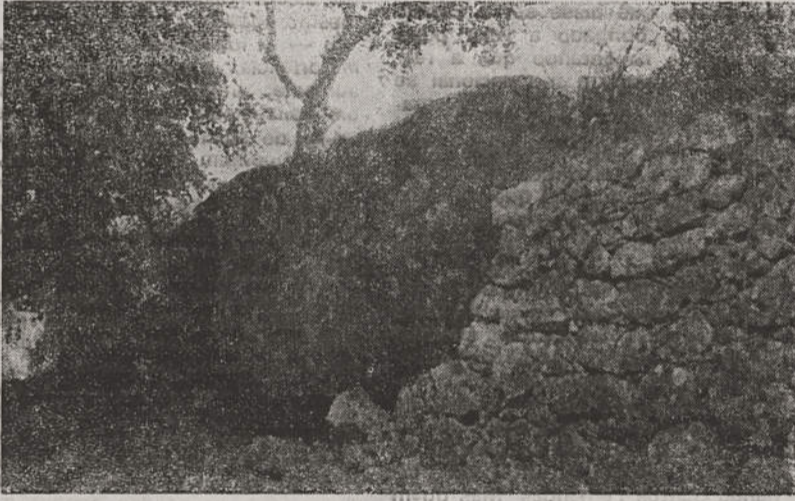
A Pedra Moirinha quando se principiou a falar dela