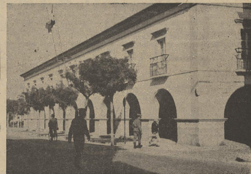
Os Paços do Concelho de Tavira