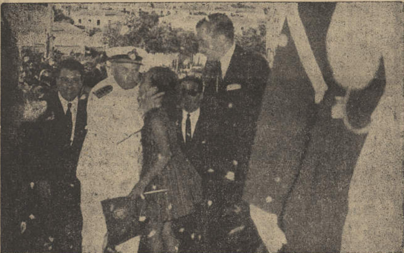
Na escadaria do edifício do Liceu, o Sr. Presidente da República acarícia uma menina que lhe saiu ao caminho a saudá-lo

curso. Em Faro, na sessão de boas vindas, o presidente da Câmara referiu-se a um caso passado em Novo Redondo (Quanza) a que ele assistira: uma pretinha que tocou na mão do Presidente «para sentir mais directamente Portugal».