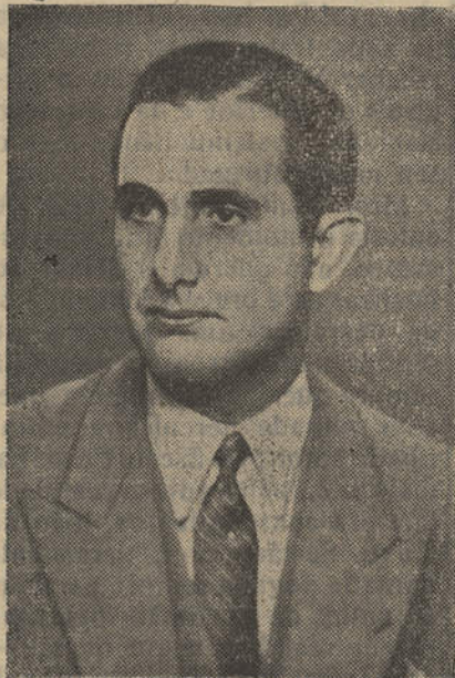
ENG.º FRANCISCO DE PAULA LEITE PINTO Ministro da Educação Nacional

Portimão conseguiu a elevação do seu Liceu a Nacional, porque soubemos merecer a atenção dos Poderes Públicos para a justiça da nossa pretensão