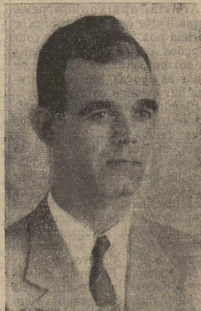
ENG.º EDUARDO ARANTES E OLIVEIRA Ministro das Obras Públicas

Portimão verá realizadas as suas restantes aspirações, se todos nós continuarmos pugnando pelo bem da nossa Terra