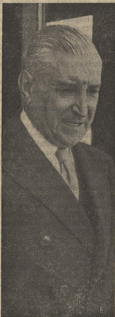
DR. ANTÓNIO DE OLIVEIRA SALAZAR