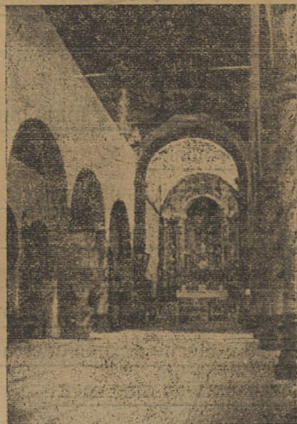
Interior da igreja paroquial de Messines onde o Poeta foi batizado

Os seus versos são o mais puro manancial de doçura, a mais penetrante e exquisita subjectivação do amor que se conhece: ali, mau grado a extensa ladinha a Margaridas e Marias, não ha mulheres mas a mulher . Em balde se procura compara-lo com outros poetas: os seus versos não acusam influencia de nenhum, influencia directa, mas parentesco quando, á semelhança de todos os grandes artistas , nos levanta mundos