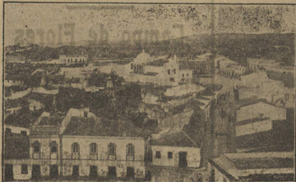
= Vista Geral =