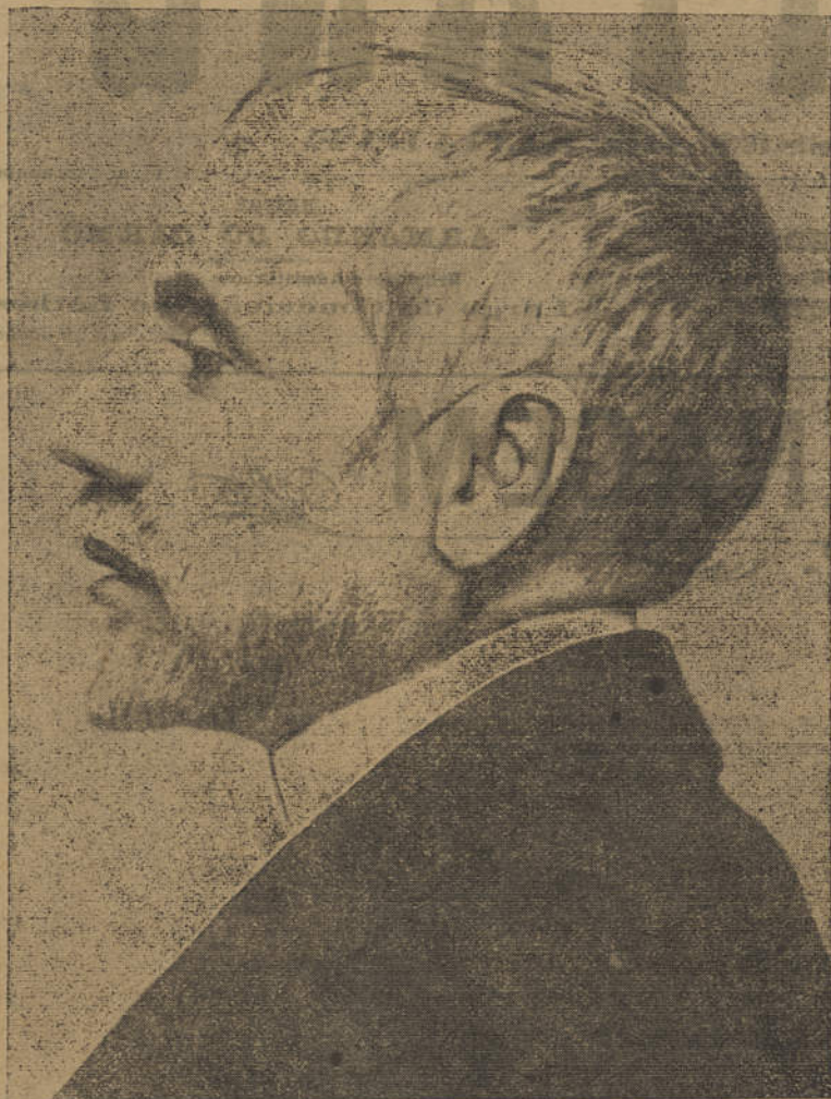
Manuel Teixeira Gomes

Ilustre Presidente da Republica — Grande amigo de João de Deus e distinctissimo escritor algarvio