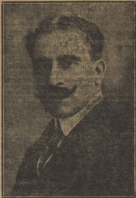
Dr. Julio Dantas

Consagrado poligrafo algarvio, antigo ministro e actual Presidente da Academia das Sciencias