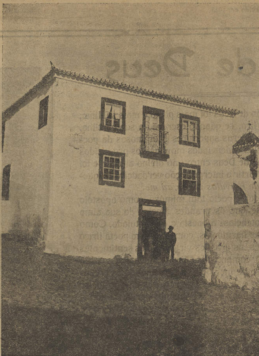
MESSINES — CASA ONDE VIVEU JOÃO DE DEUS