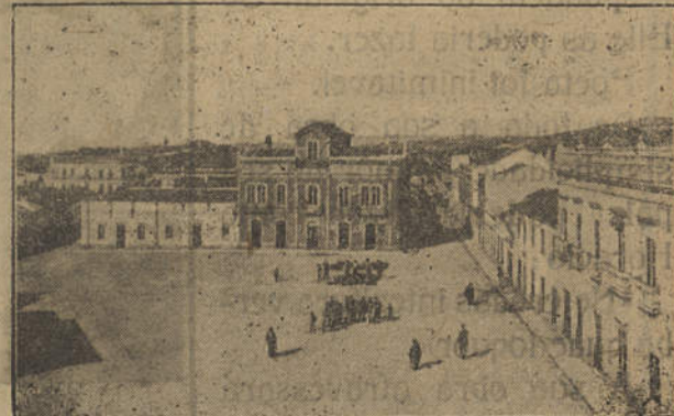
= Largo da Liberdade =