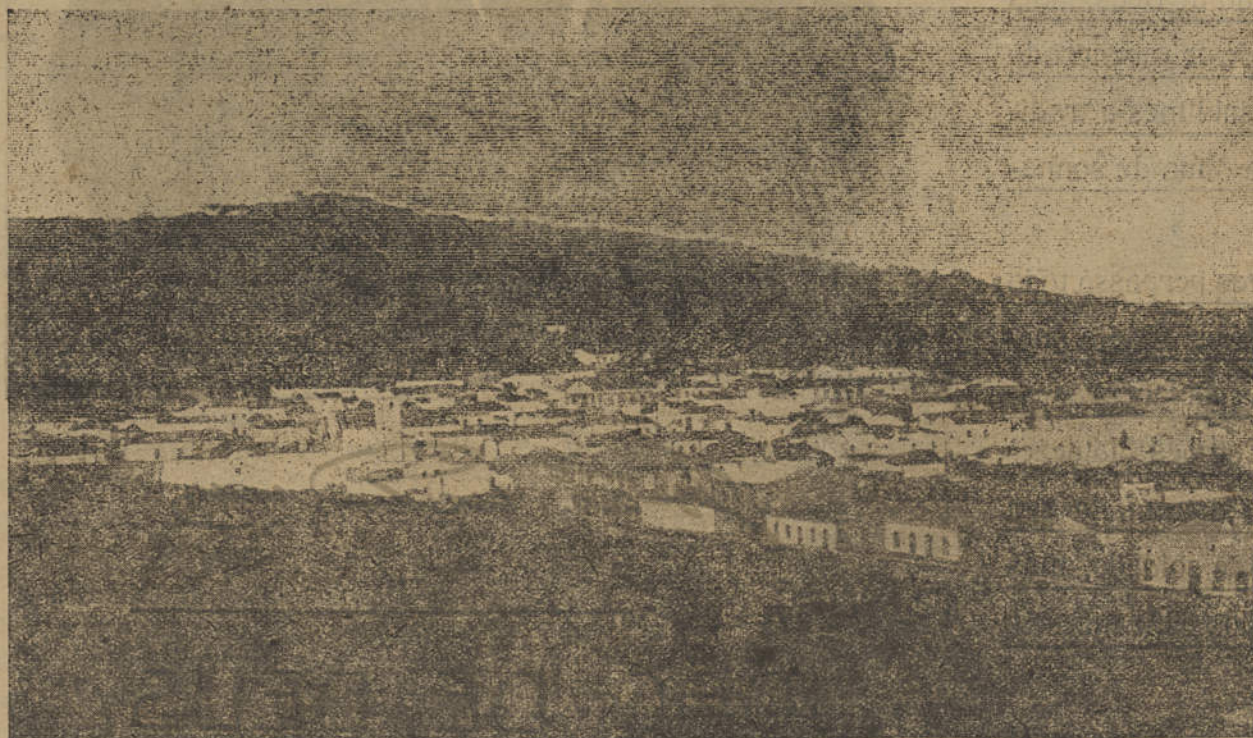
Vista Geral de São Bartolomeu de Messines, terra natal do Poeta