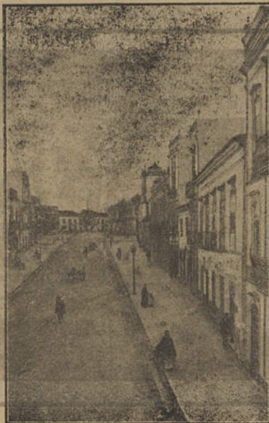
= Praça da Republica =

Naquela tarde cinsenta em que chegou até nós, como uma plangencia de Chopin, a noticia infausta da morte do poeta excelso do Campo de Flores , sobre nossas almas angustiadas de bruma desceu um expesso velario de tristeza.