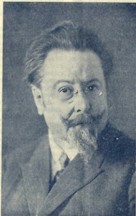
E. JAQUES DALCROZE