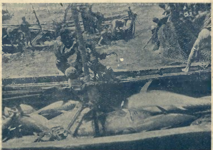
3 — PRECIOSA RECOLHA