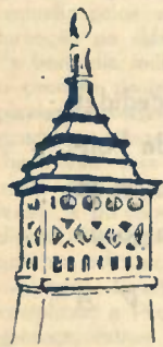
Chaminé de Borba

A chaminé, por dever sempre corresponder na casa de habitação a uma imperiosa necessidade de higiene e cómodos domésticos, tem de aparecer nela com maior ou menor primitivismo.