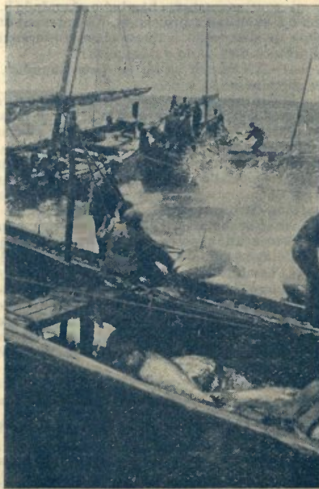
4 — UM EXEMPLAR