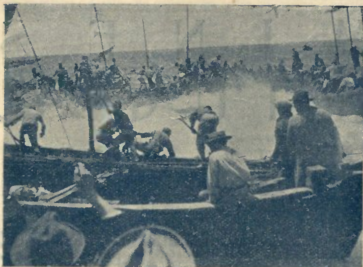
1 — APERTANDO O CÊRCO