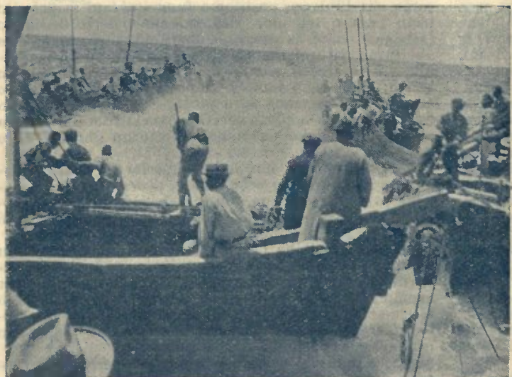
2 — PUXANDO AS RÉDES