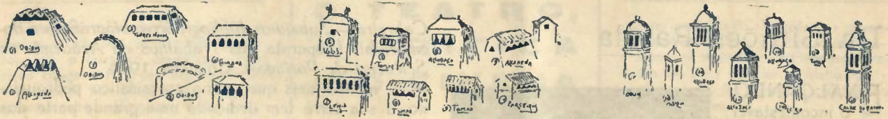
Tipos de chaminés portuguesas

abunda e toda a casa vibra na braneura intensa, que lhe dá. No entanto, no Alentejo, onde o tijolo quasi exclue a pedra na alvenaria, fazem-se combinações decorativas com esse tijolo, prática inconsciente da deco-