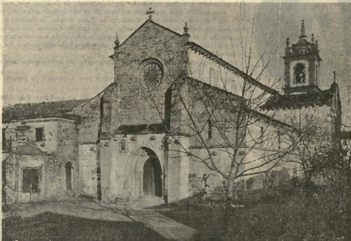
A SE' CATEDRAL

que foi recentemente elevada á categoria de Monumento Nacional