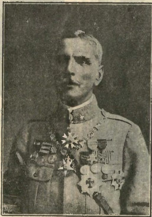
GENERAL GOMES DA COSTA

U MA galha: O "raid" a que nos referimos, na página 5. é "Lisboa-Madeira-Açores", e não "Lisboa-Açores-Madeira".