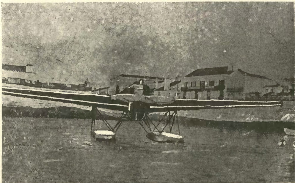
O hidro-avião "Sagres" na porta de Ponta-Delgada

As nossas gravuras são um precioso documento da passagem dos heroicos aviadores pelos Açores, onde foram recebidos com verdadeiro delírio pela população.