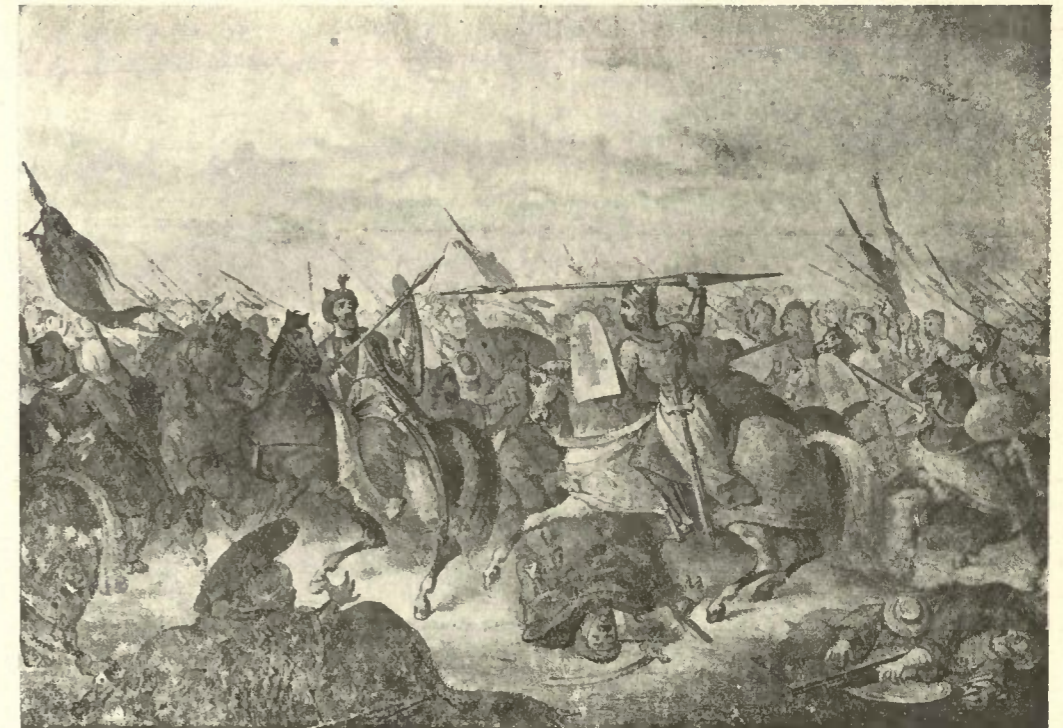
A BATALHA DE OURIQUE

“Todos os Milagres são inteiramente compreensíveis perante a Filosofia Espiritualista, — a única que tem resistido e pode resistir á acção corrosiva do evoluir humano, — impondo-se muitos dêles até á consideração dos próprios adversários dessa Filosofia por constarem de solene testemunho público e de autorizadas averiguações scientificas (1). Com efeito, uma vez que a pesquisa da Verdade, nor-