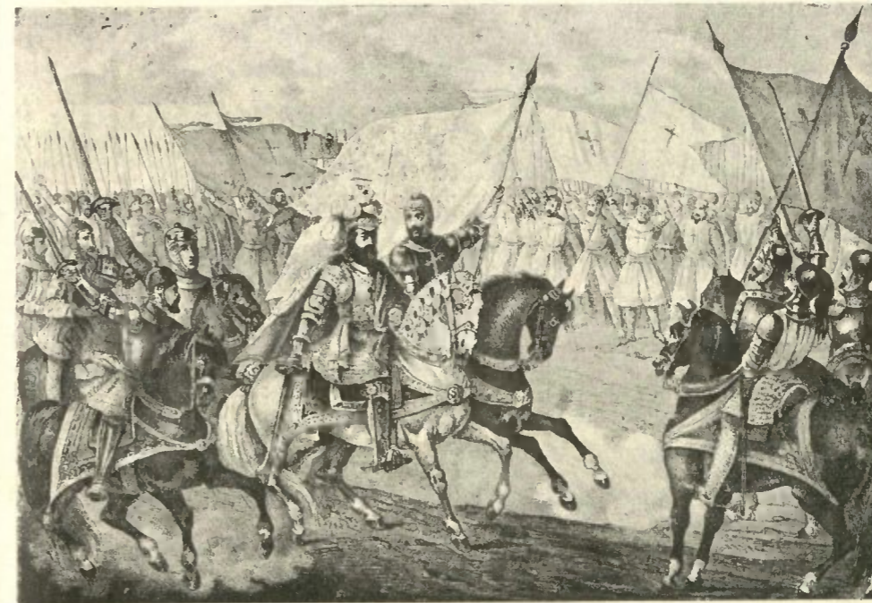
A ACLAMAÇÃO DE D. AFONSO HENRIQUES (Idem, Idem)

E se, por Milagre, Nun'Alvares consolidou a nacionalidade, e Vasco da Gama descobriu o caminho do Oriente, não será lógico supôr que o Milagre já havia permitido a D. Afonso