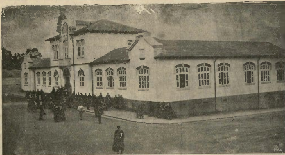
LICEU CENTRAL JOÃO DE DEUS — FARO