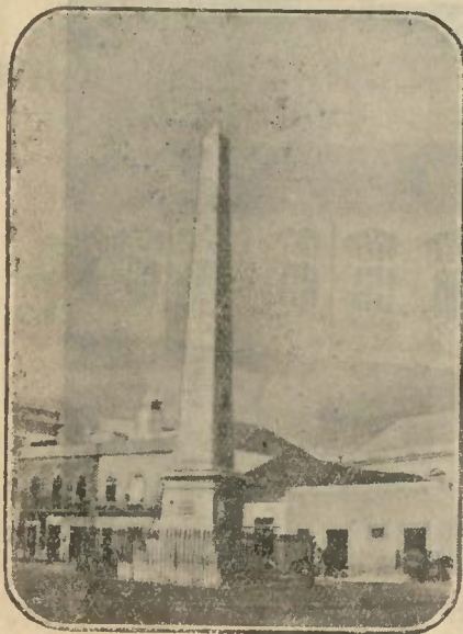
Monumento a Ferreira d'Almeida — FARO

historia tem sabido manter intacta a sua irreductivel e caracteristica individualidade.