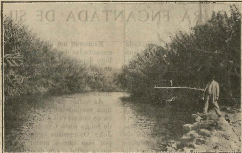
Portugal—ALGARVE—Ribeira de Paderne (Moinho das Canas)