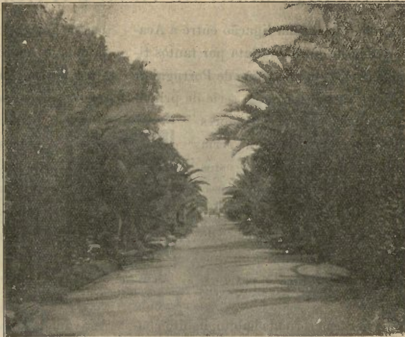
Avenida das Palmeiras — Jardim da Alameda — FARO — (Cliché de M. M. M.)

lá foram postos em nitida equação e debatidos por quem para os analisar e resolver tinha perfeita competência. A agricultura, a industria, o commercio, a navegação, os transportes terrestres e marítimos, a higiene, a beneficencia, a historia, a arte, as lendas e as tradições do folk-lore do Algarve — tudo ali teve o seu eco e, conquanto tratados em resumidas theses, todas essas variadas questões prenderam o espirito da numerosa assistencia que em cinco dias successivos assidua e zelosamente discutiu esses momentosos assumptos, que são na essencia as manifestações da actividade material e animica de um povo que, apesar de quasi desprezado pelos poderes centraes da nação, todavia, ou por uso mesmo, atravez da