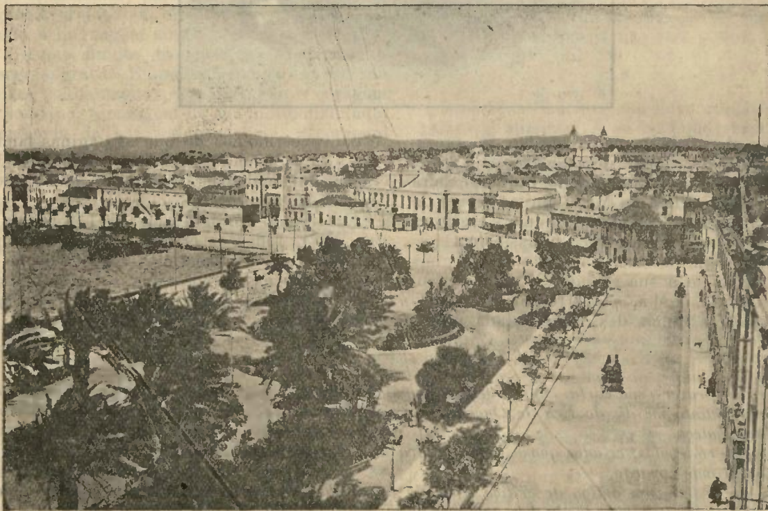
FARO = A formosa capital algarvia, onde se realizará o futuro Congresso de 1918

mais ou menos estreitamente se sentem ligados por accidentes variaveis da vida. Todo o homem culto a quem foi dado assistir a esse Congresso teve a clara compreensão de que não podia re-