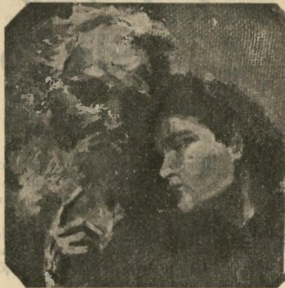
(Desenho de J. Condeça )