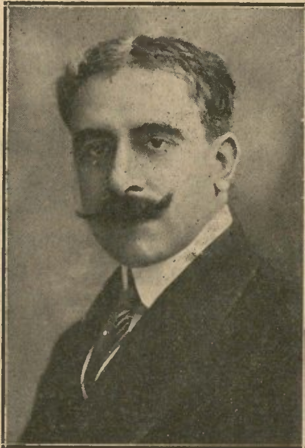
DR. JULIO DANTAS

O illustre homenageado de hoje, o sr. dr. Julio Dantas, é um dos maiores vultos da litteratura contemporanea. Autor de obras primas no teatro portuguez, além de historiador, crítico e romancista, é tambem um dos melhores poetas sonetistas das letras modernas. Honra o Algarve e honra a Patria.