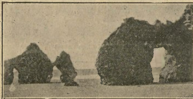
PRAIA DA ROCHA

Portos e Rios.—Irrigação.—Arborisação das serras e dunas.—Estradas.—Utilisação dos Caminhos de Ferro sob o ponto de vista do turismo e expansão das industrias e culturas algarvias.—Climatologia: Turismo e Sanatorios.—Industrias (sob o ponto de vista moderno) a criar e desenvolver no Algarve.—O Folk-lore algarvio: Lendas, Costumes e Tradições.—Museu Regional do Algarve (historico e pre-historico).—Problema do Crédito.—Estudo das culturas a desenvolver e adaptar no Algarve.