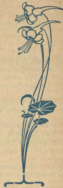
UMA CASA DE CAMPO