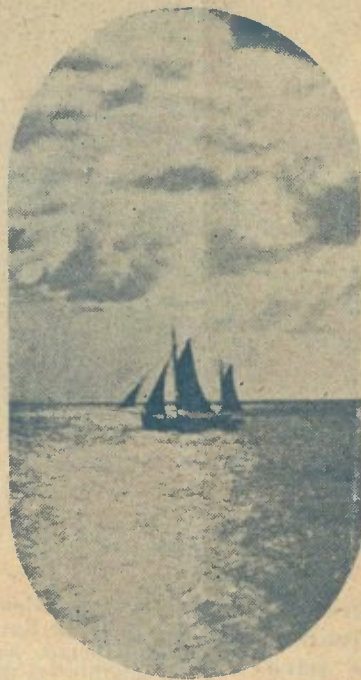
CORTANDO AS AGUAS DO MAR...