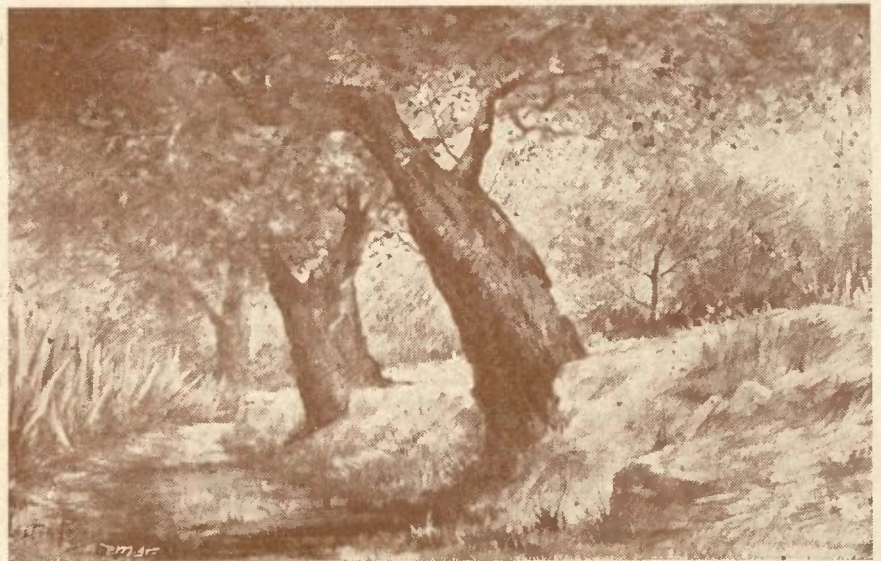
CAMINHO DO ROSAL — ESTOI (Desenho de Lyster Franco)