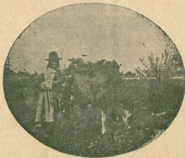
CARREGANDO O BURRINHO (Arredores de Faro)

Armar o Menino é preparar-lhe um altar e coloca-lo em exhibição, do Natal ao Reis, com o seu vestido azul celeste e a sua medalhinha ao pescoço.