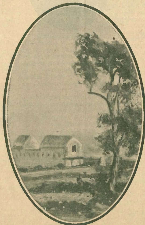
Trocho do Algarve — Horta da Atalaia