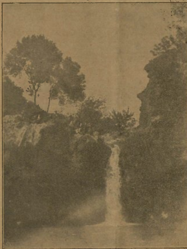
O Algarve Pitoresco—Pego do Inferno—Tavira

Correspondentes e Representantes nos principais institutos de ensino