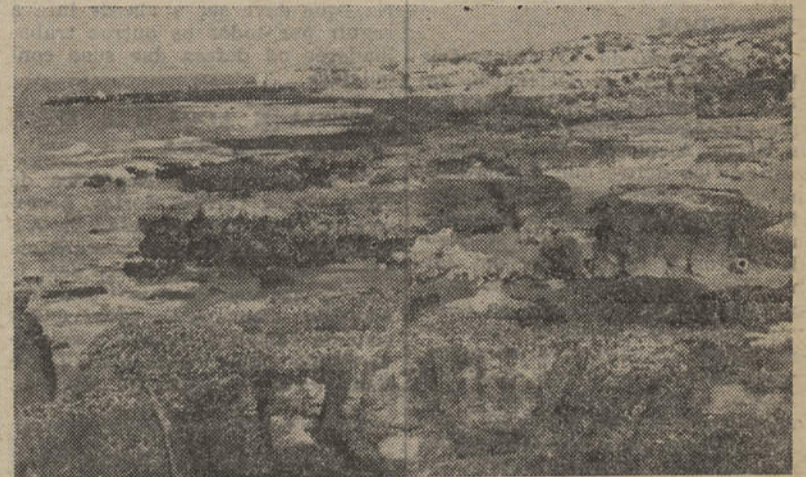
A praia da Pedra da Galé, próximo de Armação de Pêra