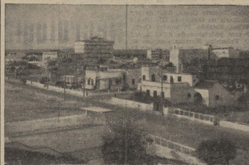
As pequenas (como as grandes) terras do litoral algarvio acenam, em Agosto, os efeitos de uma afluência para cujo aproveitamento estão ainda longe de se encontrar convenientemente apetrechadas.