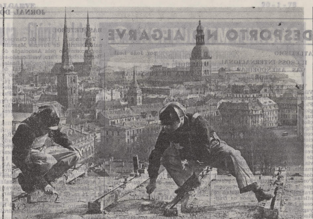
O primeiro lugar no mundo quanto ao volume de construção, é actualmente ocupado pela URSS. Cinquenta mil pessoas mudam ali diariamente para novas casas, o que dá ideia do extraordinário incremento que se vem registando no sector de construção de novas habitações.

na vida real é uma mulher afável, boa conhecedora das pessoas e dos seus problemas, rosto atractivo, emoldurado por longa, quase exótica cabeleira, onde uns olhos vivos, pequenos e escuros, deixam adivinhar uma inteligência e um desejo inesgotável de saber, bem diferentes dos que notávamos no amoral primitivismo da «sua» mulata «Gabriela».