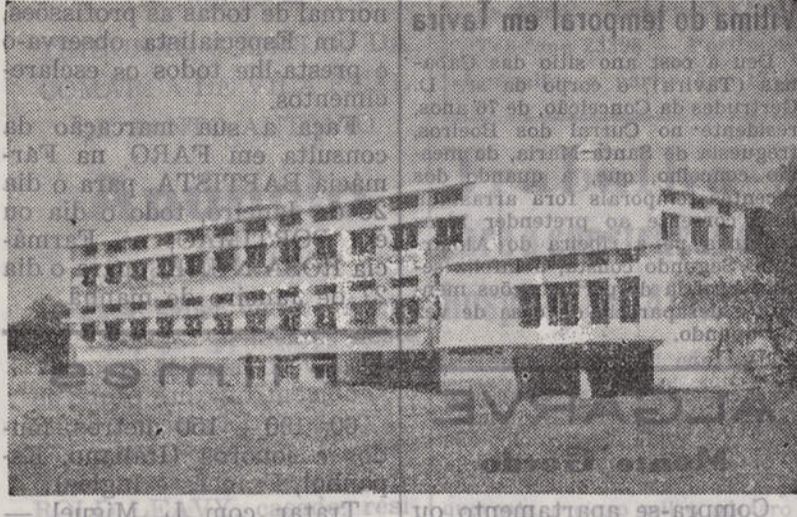
O Externo de S. Brás de Alportel