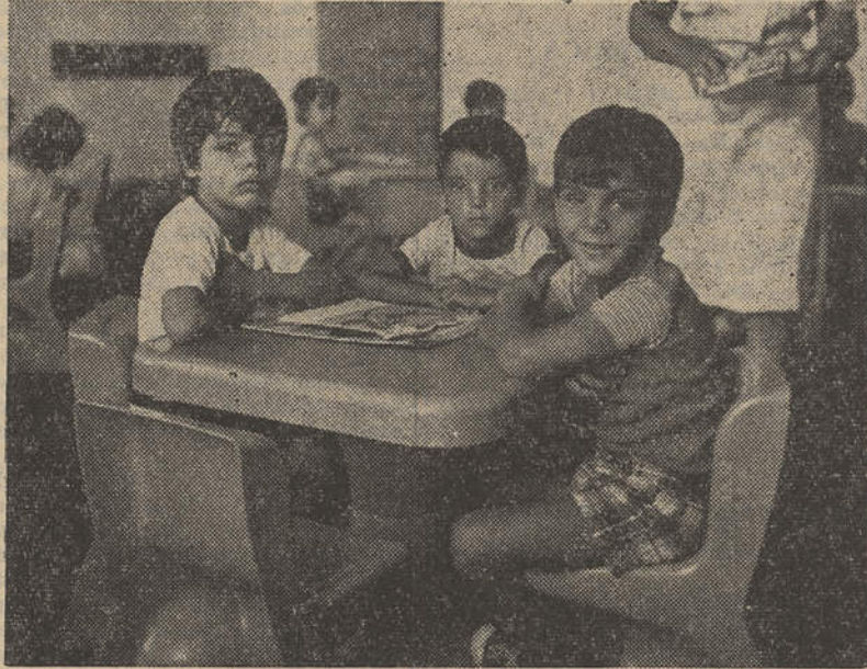
Um grupo de descontraídos utentes do Jardim Infantil de Vila Real de Santo António