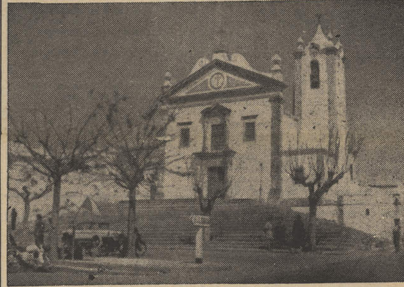
A igreja matriz de Estoi