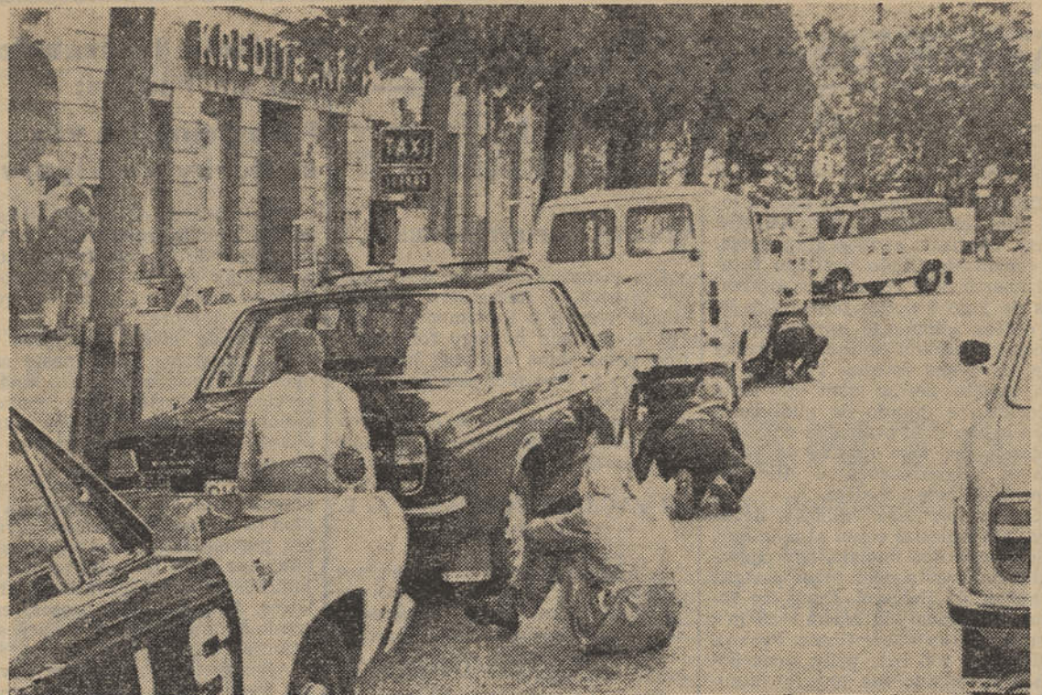
Uma imagem do mundo conturbado em que vivemos. A porta de um banco de Estocolmo, agentes da policia aguardam pacientemente que um bandido instalado no interior com quatro reféns, resolva entregar-se. Foram dias de ansiedade e tragédia!