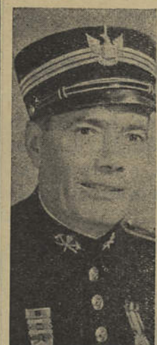
Herculano da Silveira Herdade