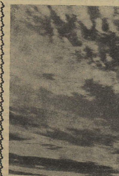
A gaiota é uma ave simpática. Como vive no litoral é um pássaro marinheiro, portanto camarada do pescador cuja vida, em certas ocasiões, facilita, assinalando-lhe a presença do peixe.