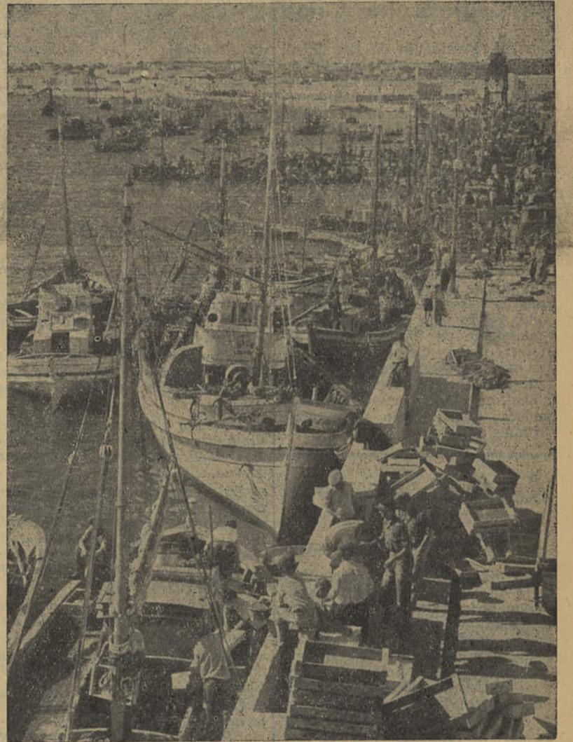
Algumas unidades da frota de traineiras do Algarve atracadas ao cais de Portimão

Durante a visita, o sr. ministro das Obras Públicas forneceu esclarecimentos ao sr. Presidente da República, o qual, ao fim da tarde, regressou a Lisboa.