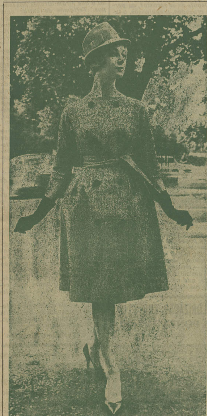
Vestido e chapéu primaveris. O modelo é de castanho pintalgado de azul. Luvas pretas.

Celebrou-se na passada semana a escritura do contrato para o fornecimento e exploração de energia eléctrica entre a CEAL e a Câmara Municipal de Castro Marim, devendo esta vila estar totalmente electrificada em meados de Setembro do corrente ano.