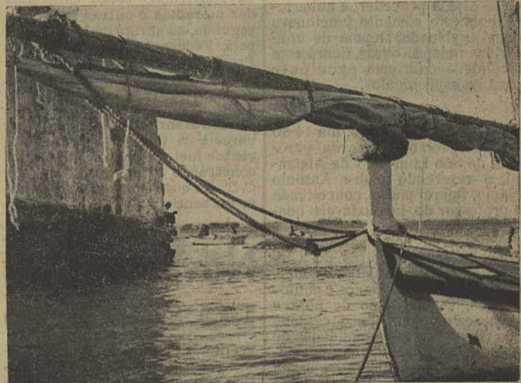
Ponta da Areia — Ruínas da antiga cidadela de Santo António d'Arenilha