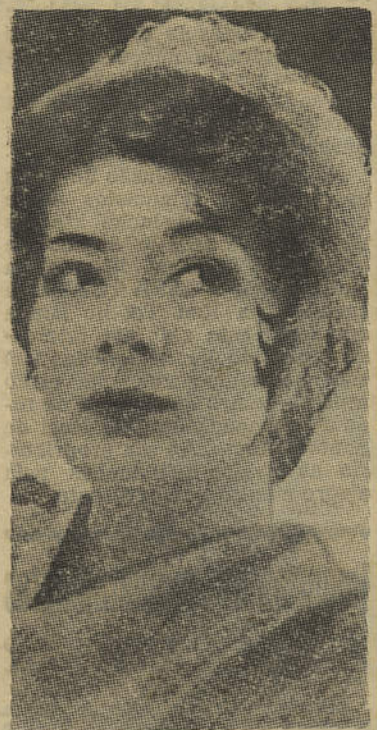
A famosa artista francesa Julietta Grecco, que o público cinéfilo de Vila Real de Santo António há pouco admirou no filme «A Lenda do Reno».