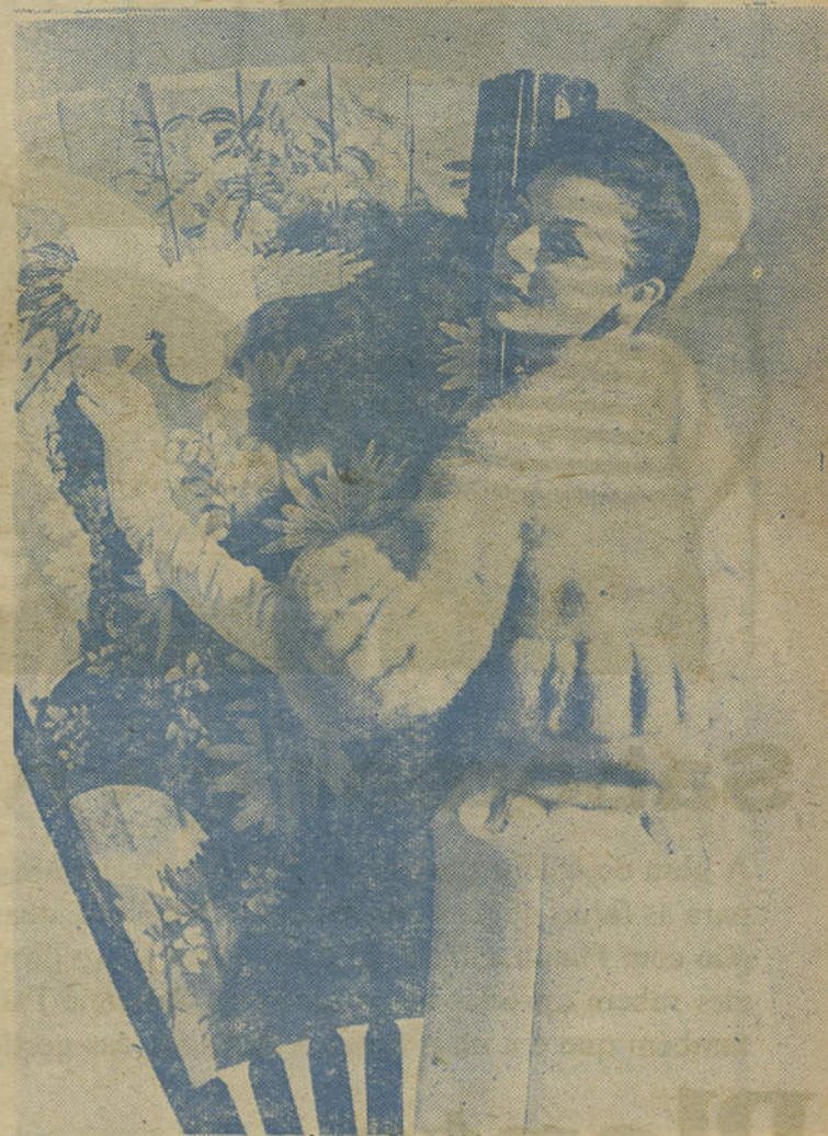
«Florilège» é o nome deste bolero de «vison», trabalhado no sentido horizontal. O chapéu, também de «vison», tem a graça dos capuchinhos para ilustrações de contos infantis