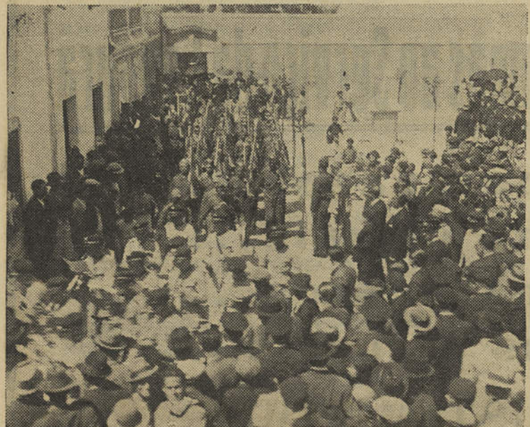
Inauguração do Largo Luthgarda de Caires, em Vila Real de Santo António, no dia 18 de Abril de 1937