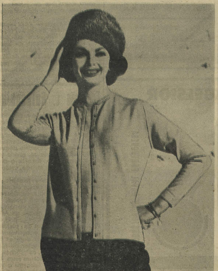
Eis, estimadas leitoras, um dos mais modernos e práticos conjuntos tricotados para este Outono, que é deveras muito elegante e prático. Pode vestir-se com umas calças justas ou com uma saia escura pregueada