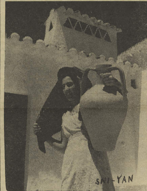
A mulher aguadeira, de chapéu e lenço, tendo por fundo o rendilhado de uma chaminé algarvia — conjunto harmonioso da mais sulina província portuguesa