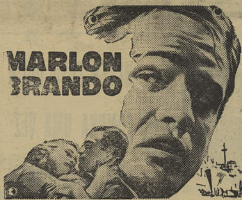
Imagem do filme «Há Lodo no Cais» recentemente exibido pelo Cineclube de Faro e de cujo programa extraímos a seguinte passagem: «Há Lodo no Cais» apresenta algumas dificuldades. Para falar nele vamos esquecer que Elia Kazan, realizador, Bud Schulberg, argumentista, «convocados» perante a Comissão de Actividades Anti-Americanas, fizeram declarações significativas; vamos esquecer que o sindicato dos estímulos, meio onde decorre a acção do filme, é dos sindicatos que mais cedo impuseram a sua vontade e se libertaram do domínio dos «gangsters»; e finalmente vamos esquecer que durante a