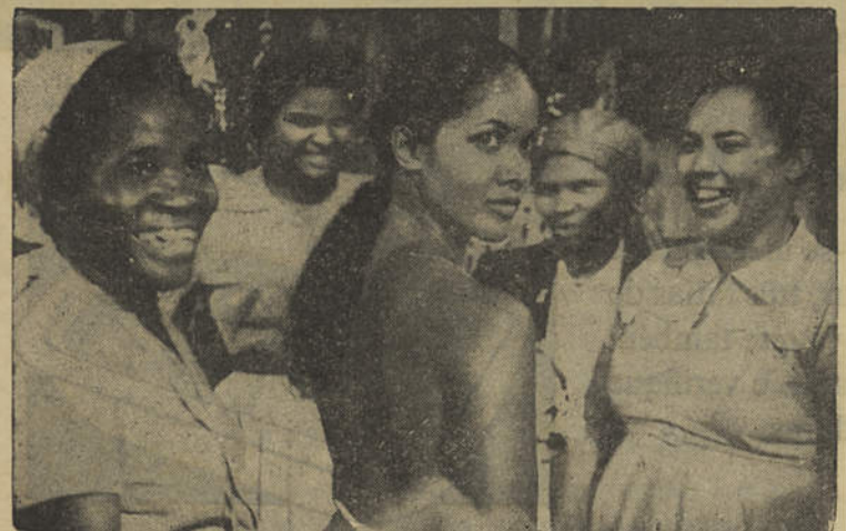
LEIA NA NOSSA SECÇÃO DE CINEMA O ARTIGO SOBRE O «ORFEU NEGRO»

Segundo informações que nos foram prestadas existem inúmeros capitalistas interessados nos terrenos, pelo que estamos certos que na futura época balnear já se encontrará a funcionar mais uma magnífica unidade hoteleira na Praia de Monte Gordo.