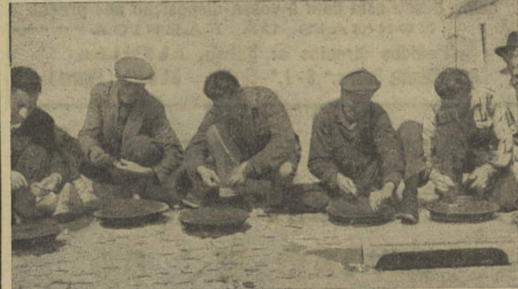
UMA RIQUEZA OFERECIDA A ESTRANHOS

Agarrado à roda do leme, e chorando, queria ir para o fundo com o seu barco, tendo os companheiros sido obrigados a arrastá-lo para um dos botes, apesar da sua resistência.