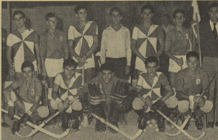
Duas das três equipas de Loulé, de hóquei em patins

Tudo isto nos satisfaz, ao ver o que faz a boa vontade de alguns rapazes, aos quais se lhes depara um grave problema, não há no Algarve outras equipas, além da de Albufeira, para que se possam defrontar, entrando assim numa fase