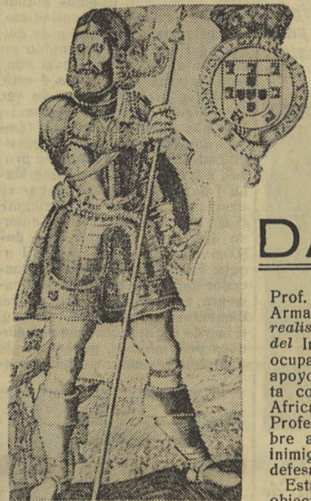
(Conclusão da 1.ª página)