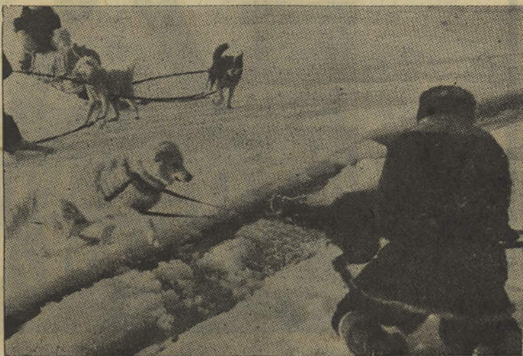
No cenário sempre belo dos gelos eternos, o fiel amigo do homem, presta inestimáveis serviços na locomoção de trenós; atarefado a atrelar os cães do seu trenó vemo Anthony Quinn, quando das filmagens de «Sombras Brancas», inteiramente rodado no Polo Norte.