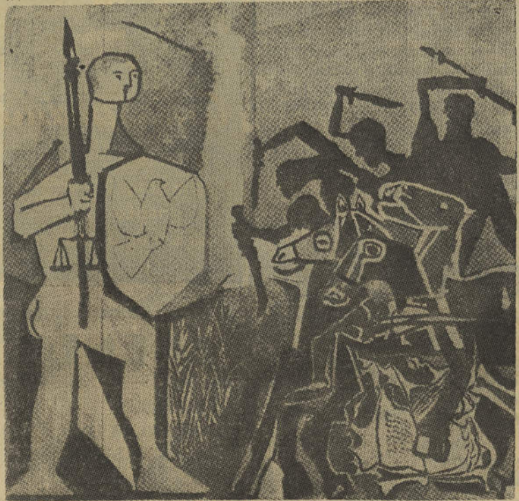
«GUERRA» DE PICASSO

É como poderia alguém interpretar aquilo que eu realmente queria dizer e que havia exprimido talvez sem intervenção da minha própria vontade?