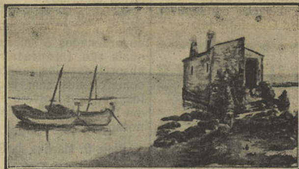
OLHÃO — Antigo moinho da Barreta