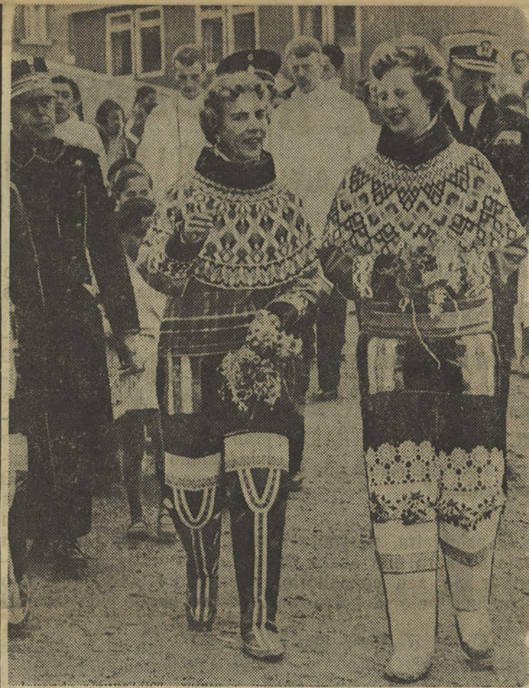
Numa recente visita à cidade de Umenach, na Gronelândia, a Rainha Ingrid da Dinamarca e a sua formosa filha Princesa Margarida apresentaram-se vestidas com um tradicional fato de pele de foca originalmente bordado.