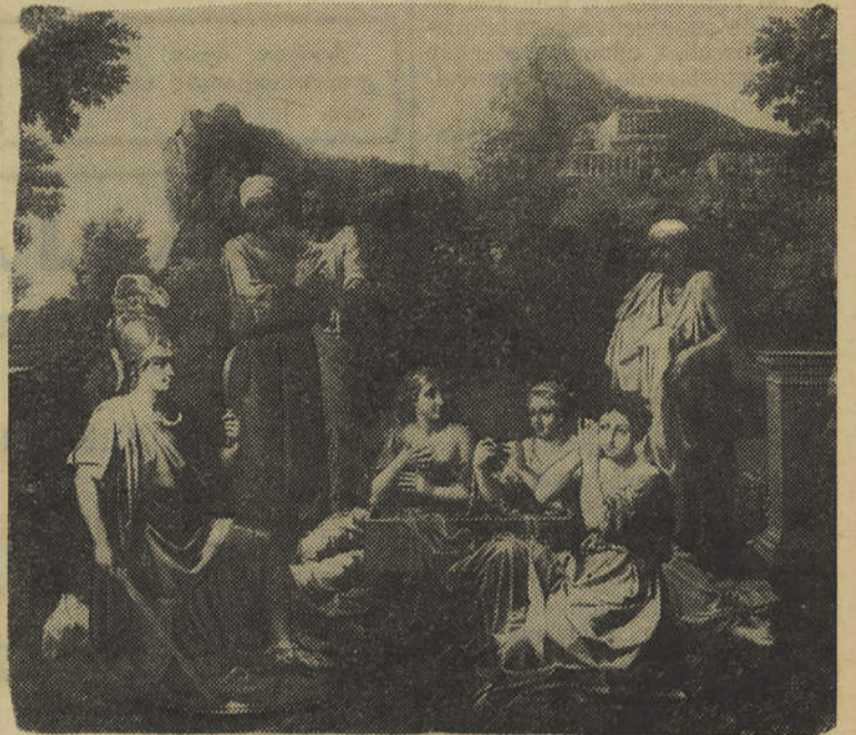
Peça fundamental na obra de Poussin, intitulada «Aquila reconhecida no meio das filhas de LYCOMEDE» pertence ao valioso património do Louvre.

co, em quem a simplicidade do camponês transparecia tanta vez sob as formas da mais alta cultura, seja objecto, perante uma «Elite» internacional, de um culto tão fervoroso como esse de que foi alvo, no decorrer dos nossos dois séculos de classicismo.