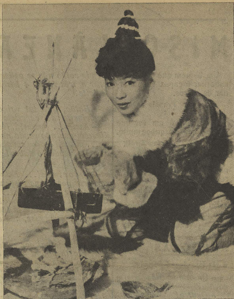
Saboreando um bocado de foca, aparece-nos a bela actriz Yoko Tani, que a propósito da cozinha esquimó, que teve a oportunidade de saborear durante o filme «SOMBRA BRANCA», confia-nos: — Não era tanto o mastigar que era difícil, mas engulir-lá é que era um problema.