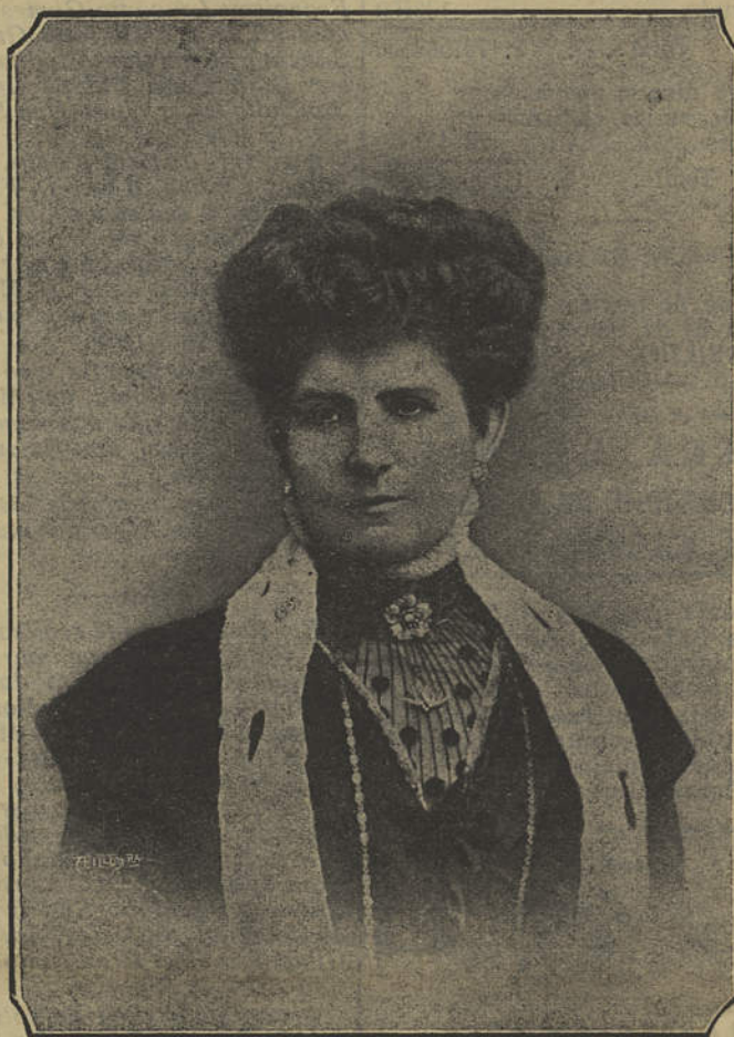
POETISA LUTGARDA DE CAIRES