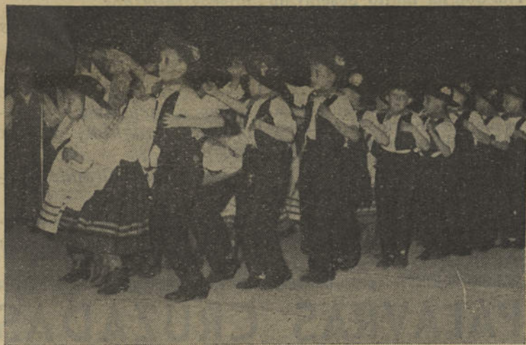
Rancho Folclórico Infantil das Escolas Primárias