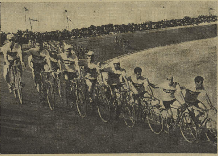
EQUIPA DO GINÁSIO CLUBE DE TAVIRA

— Sim, porque só quem viu as dificuldades extremas que os rapazes tiveram de vencer, dificuldades aumentadas pelo verdadeiro temporal que se fez sentir nas primeiras jornadas, pode avaliar o esforço que tiveram de dispendir. Naturalmente os nossos ciclistas sentiram mais que quaisquer outros a dureza do clima, o frio e a chuva, habituados como estão ao clima algarvio. Julgo pois