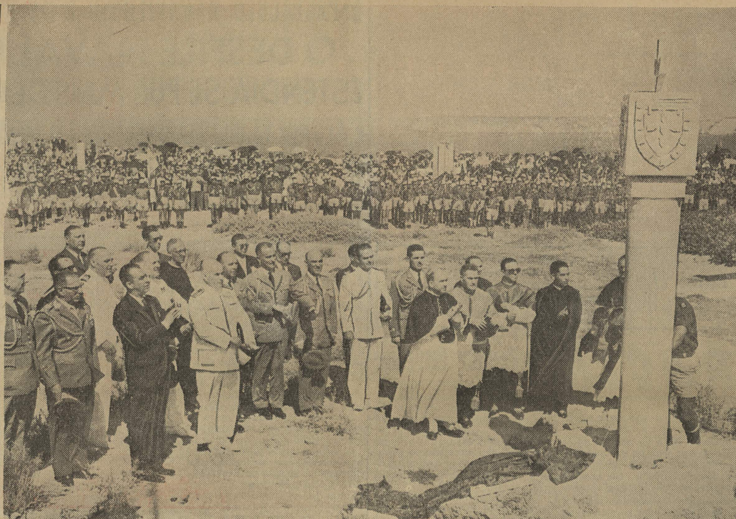
No cenário imponente de Sagres, o fundador da Brasília aplaude, frenético e comovidamente o padrão henriquino ora descerrado que ficará eterno como eterno foi o sonho do Infante, o Solitário.