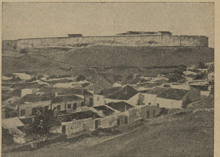
VISTA PARCIAL DE CASTRO MARIM