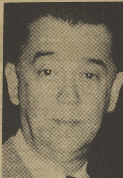
DR. KUBISCHECK DE OLIVEIRA

SAGRES é uma raiz cravada na terrado Continente, de onde hauriu a seiva, e debruçada sobre o mar por onde cresceu e se desenvolveu bracejando por todos os cantos do mundo. O seu ramo mais vigoroso tornou-se no portentoso Brasil tão amigo, tão carne da nossa carne, que os portugueses se sentem brasileiros e os brasileiros portugueses.