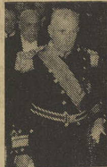
ALMIRANTE AMÉRICO TOMÁS

Nesta hora alta de patriotismo, de deslumbramento, curvemo-nos ante a memória do Gigante que a tornou possível e saudemos com carinhosa emoção o Brasil na pessoa ilustre do seu mais alto representante Sua Excelência o Senhor Doutor Kubischek de Oliveira que não é nosso hóspede porque o consideramos nosso compatriota, Português entre portugueses.