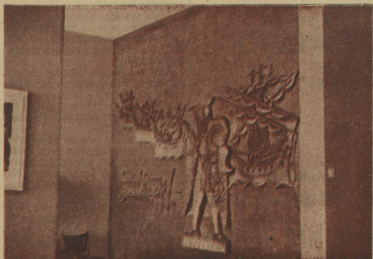
Painel de entrada do Hotel representando Vasco da Gama

Ainda este ano e logo após a época balnear terão início os trabalhos para a construção do prosseguimento do Hotel «Vasco da Gama», no sentido de Vila Real de Santo António, o que permitirá o moderno Hotel ficar acrescentado de mais 45 quartos.