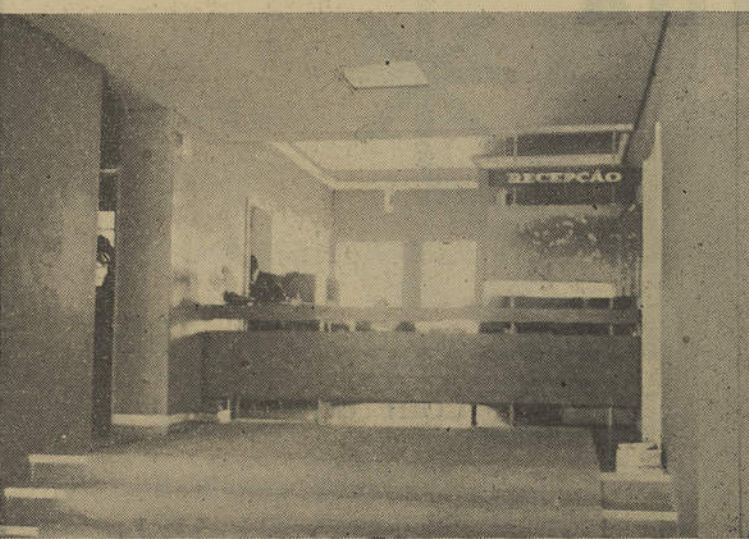
Um aspecto do Hall do Hotel e Sala de Recepção

NUM ambiente de requintado bom gosto, onde o regionalismo é exaltado em magníficos quadros a óleo, aguarelas e fotografias e de decorações de refinada elegância, encontra-se desde segunda feira, dia 1 de Agos-