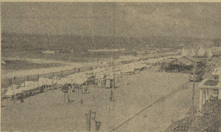
Uma magnífica panorâmica da Praia de Quarteira

Serão dadas a presenciar Festas Folclóricas, Baile Masqué, Jogos Floriais e demais atracções de grande interesse no cartaz turístico da nossa Provincia.