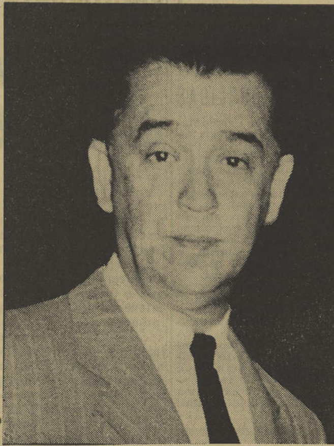
Presidente Kubitschek de Oliveira

Oliveira. Qualquer semelhança entre esta carta e as missivas que costumam permutar os Chefes de Estado ou de Governo — é pura coincidência, não há nela nada de formal, ou de artificioso; não tem reticências nem entrelinhas; é de uma simplicidade e de uma espontaneidade invol-