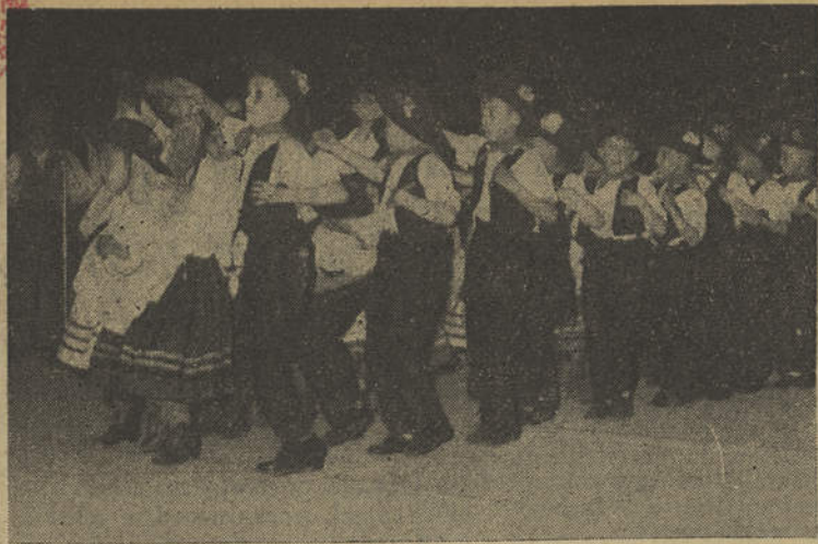
GRUPO FOLCLÓRICO INFANTIL DAS ESCOLAS PRIMÁRIAS DE VILA REAL DE SANTO ANTÓNIO — Graças à força de vontade dos professores das Escolas Primárias do concelho de Vila Real de Santo António, foi constituído o Grupo Folclórico das Escolas Primárias deste concelho, cujas actuações nesta vila como em Faro, têm sido autênticos sucessos, estando o mesmo grupo convidado para actuar na presença do sr. Presidente da República e do Presidente Kubitschek de Oliveira, quando das Comemorações Henriquinas em Sagres