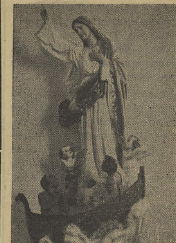
Imagem de Nossa Senhora dos Navegantes