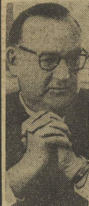
O GOVERNADOR BROWN

AQUELE «morrerei com dignidade» de Chessman, ficou a ecoar para além dos muros cinzentos da prisão de San Quentin. Ninguém lho impedia de morrer com dignidade após 12 anos de tortura e de espera quando a câmara de gás lhe acenava do fundo do corredor da morte. Os próprios companheiros de infortúnio, a quem ele ensinou a maneira legal de adiar a execução, lembram-se, de certo, quando entrarem na masmorra mortífera do século XX, daquele seu «até amanhã de manhã, amigos» — e isso talvez seja suficiente para que igualmente saibam morrer com dignidade.