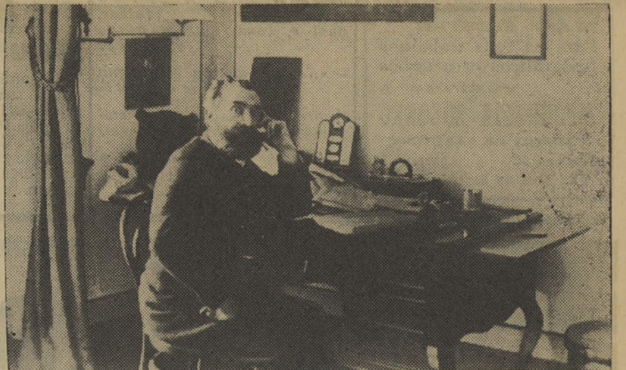
João de Deus no seu gabinete de trabalho (fotografia tirada por ocasião da apoteose de que foi alvo)

Mas não deve ficar por aqui o tributo da nossa gratidão. Se ele tanto estremeceu as crianças, deve haver na Província,