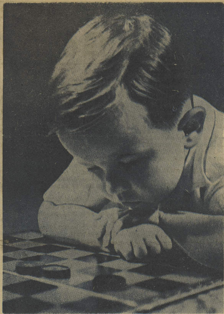
Debruçado sobre o tabuleiro das Damas, esta criança atenta e pensativa, estuda a possibilidade de mudar a pedra sem perder. Todos nós gostamos de mudar a pedra da própria Vida — sem perdermos.

Os «fans» lisboetas estão já a postos para este fim de festa e oxalá o marido não seja piropado com essa história do bebé com voz de tenor que deu brado em todo o mundo da má língua. Se a Bardot vier, porque dela tudo se espera, prometemos, desde já, aos nossos leitores uma reportagem sensacional da chegada ao aeroporto da tão espectacular B. B. com as «tais» gravuras que o leitor conhece. Combinado?