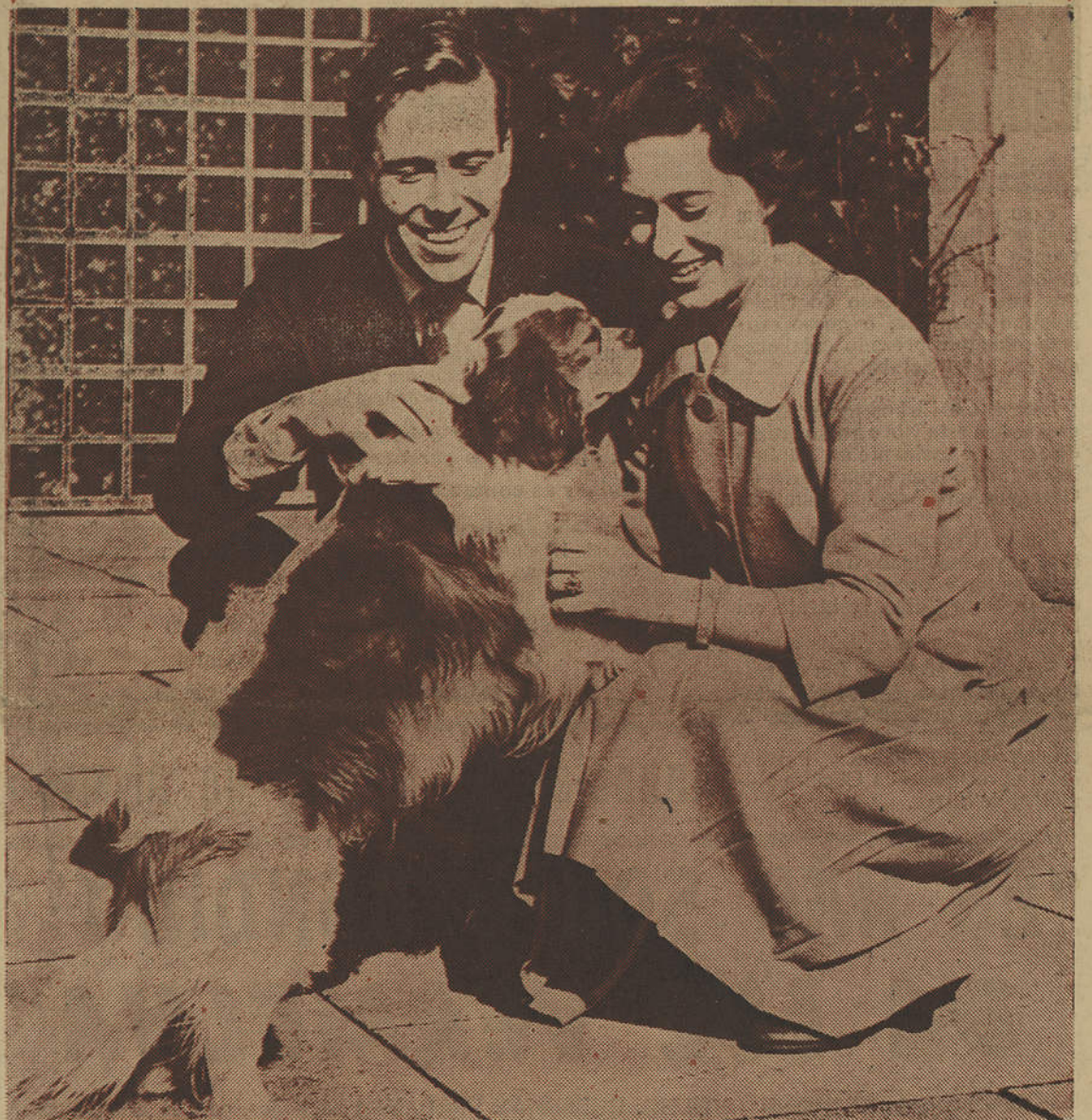
A Princesa Margarida e Anthony Armstrong-Jones brincam, felizes, indiferentes aos comentários da imprensa londrina, no terraço de Royal Lodge, no Windsor