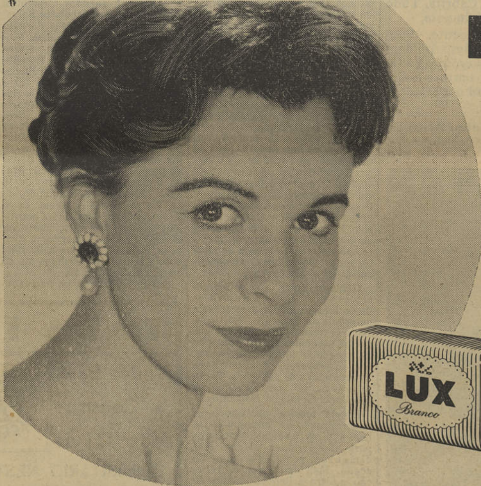
CLAIRE BLOOM — estrela do filme «Corsário Lafitte» um filme Paramount — Vistavision — Cor por Technicolor

Ha mais de 60 anos ASPIRINA e BAYER familiares a todos.