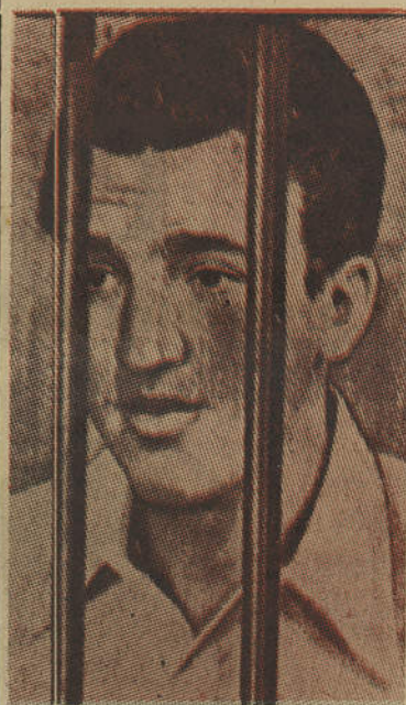
CARYL CHESSMAN: 37 DIAS DE VIDA

FALTAM 37 DIAS PARA UM CONDENADO morrer na câmara de gás. Esse condenado em nome da lei, chama-se Caryl Chessman. o mundo cristão debruça-se, curva-se, perante este cruaicante dilema: culpado? A Justiça retém um homem encerrado numa cela do Corredor da Morte há onze anos e meio, e a pergunta surge: culpado?