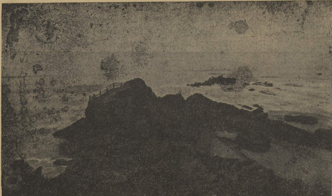
MAR PORTUGUÊS, MAR ETERNO — Seja na Ilha da Madeira, seja no Algarve, seja em qualquer outro ponto da costa portuguesa — o Mar é sempre um monumento de audácia, de beleza e de aventura

Terceira crónica: Assim entramos, no Novo Ano, ao som do Corridinho.