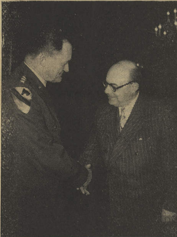
Em visita a Lisboa, o General Charles Palmer, Subchefe das Forças Americanas na Europa, foi recebido pelo General Botelho Moniz, Ministro da Defesa Nacional.