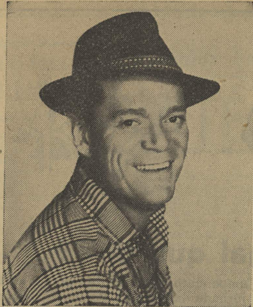
EDDIE CONSTANTINE — O «mau» do cinema francês, há algum tempo afastado das telas mundiais, vem, segundo se diz, ao «Carnaval do Estoril» — oxalá que não venha com as loiras explosivas dos seus filmes, senão...