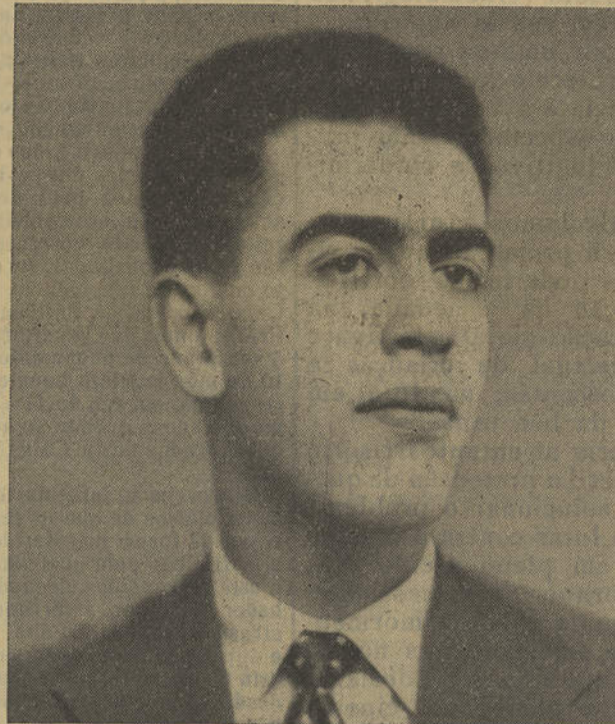
O mar pródigo, o mar lutuoso... que ele tanto amava.

AS LARANJAS ERAM AZEDAS, O BERLINDO DO JANICA, A CRIANÇA E A MOEDA, A MANTA, etc, em que soube, como bom psicólogo e artista da palavra, interessar-nos e levar-nos sugestivamente até a uma conclusão particular e generalizada simultaneamente. Algumas fabulações revelam-nos uma faceta humorística. Referimo-nos ao naturalismo filológico que deflagra sempre num oportunismo exacto e que, melhor interpretado, revela uma profundidade trágico-cómica. Os problemas que açoitam os miúdos nascidos na «Beira-mar», nunca foram acolhidos com tanto carinho e objectividade. Aliás, outros contos e narrativas refletem novas facetas do seu espírito prolífico, sagaz e atento: quer objectivo, seguro e exacto, quer poético e divagador. É agradável ler e saborear os ideais, sentimentos, lisuras, ângulos e planos interpretativos que a par e passo se nos depara nos seus contos e narrativas que mais não são, finalmente, que seres e factos que por nós passam diariamente, mas que nos sugere e oferece à vista, ao entendimento e ao coração, como oásis de existência perdidos na bruma feita da pressa da nossa luta, da nossa distração, da nossa indiferença ou do nosso egoísmo.