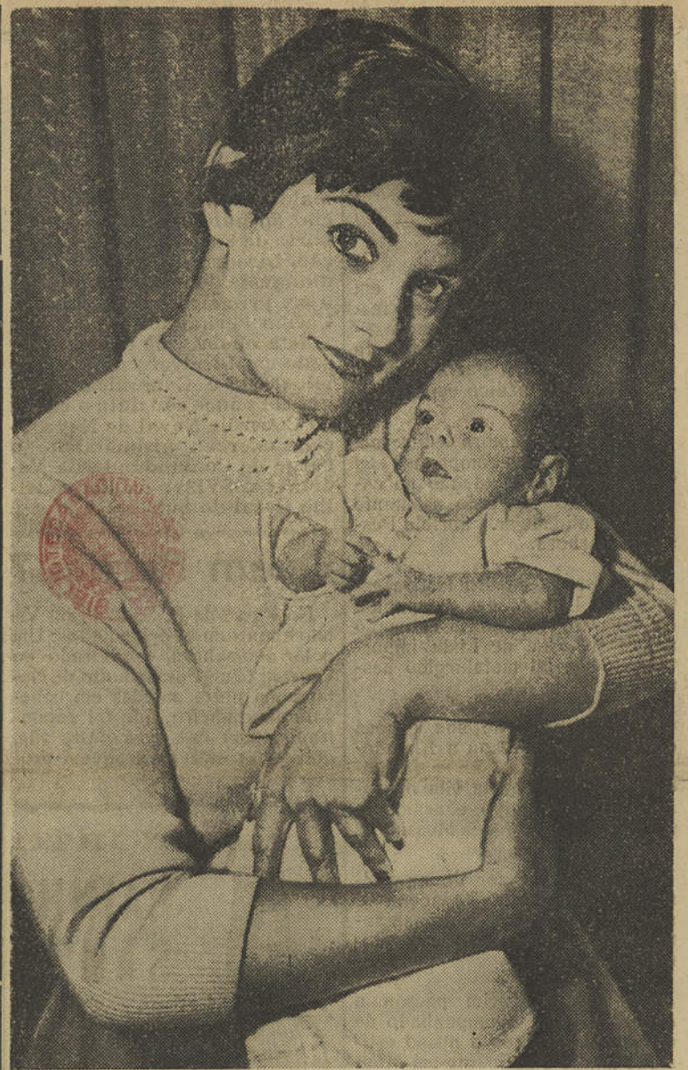
Um quadro patético que o mundo conhece; a mulher e o filho do artista que a morte roubou no apogeu duma carreira fulgurante: Tyrone Power. O filho nasceu, mas nem conheceu, nem pôde ver já a ribalta de seu pai que o idolatrou e lho roubou para sempre.

Divulga-se por todo o lado, conquista o turista estrangeiro que vem a Portugal e que leva consigo. (Conclui na 4.ª página)