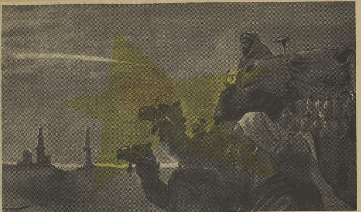
LEGENDA ETERNA DE UM NATAL ETERNO: OS REIS MAGOS

REDACÇÃO E ADMINISTRAÇÃO - RUA MINISTRO DUARTE PACHECO, 9 TELEFONE 59 - VILA REAL DE SANTO ANTÓNIO COMPOSIÇÃO E IMPRESSÃO - TIPOGRAFIA SOCORRO VILA REAL DE SANTO ANTÓNIO