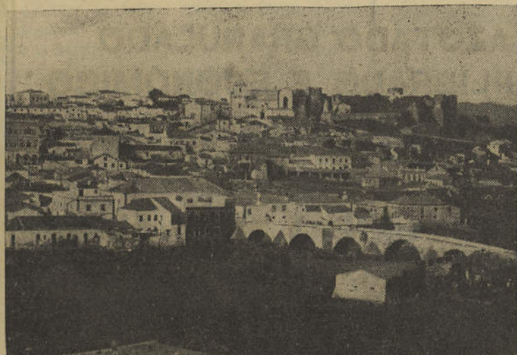
Vista Panorâmica de SILVES