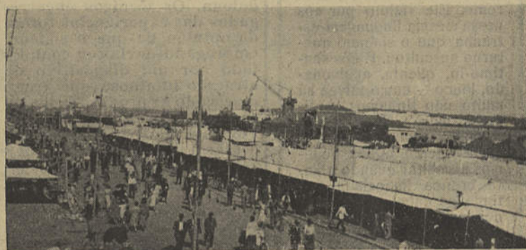
Feira da Praia — Vila Real de Santo António