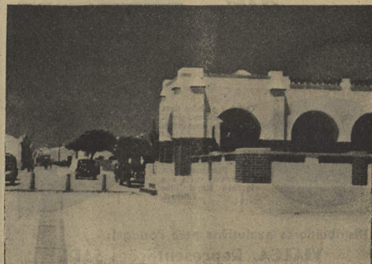
Casino da Praia da Manta Rôta—Vila Nova de Cacela