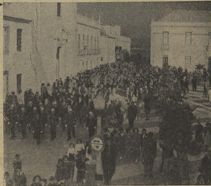
Um aspecto do I Cortejo de Oferendas realizado em 1956