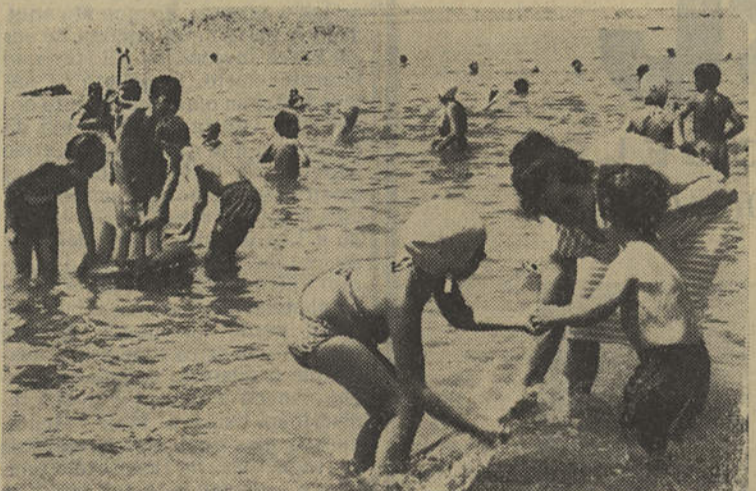
A «hora do banho» que a cidade agora também pode dar, sem o veraneante se deslocar à praia...