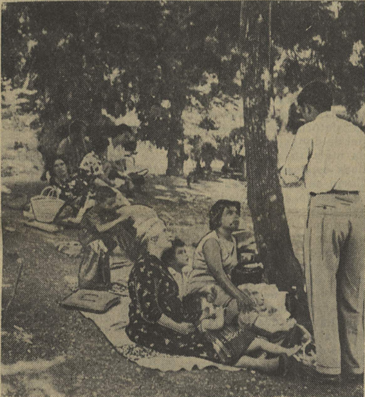
«Será que as formigas comeram o coelho?»