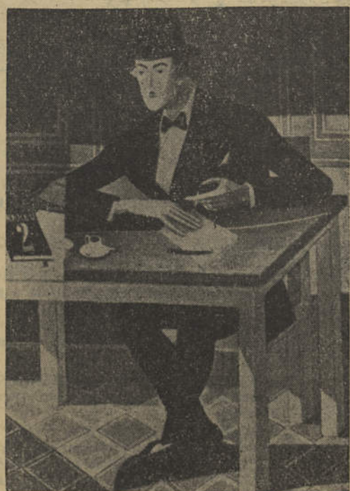
FERNANDO PESSOA — Óleo de Almada Negreiros

até nós um motivo de interesse, de arte, de cultura portuguesa.