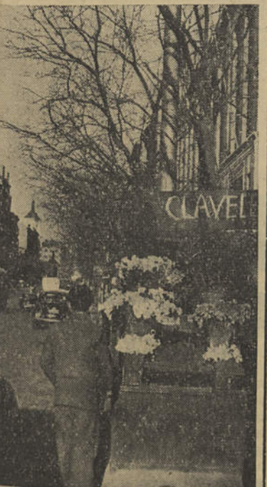
As eternas flores de Espanha

Surpreende o alto poder de recuperação e, ainda mais, a maneira simples como ele se vem verificando.