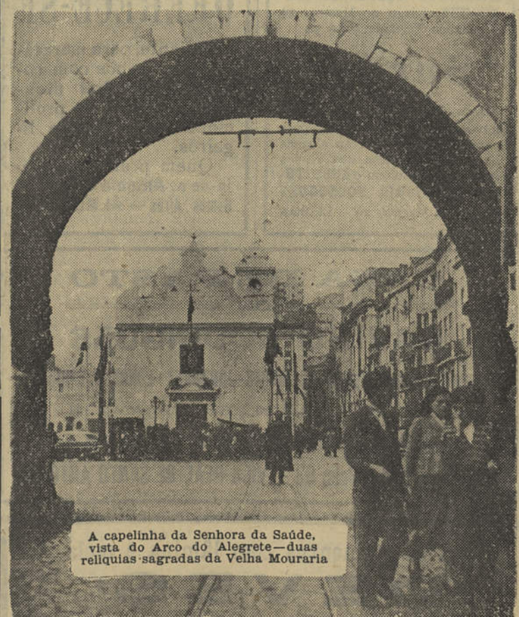
A capelinha da Senhora da Saúde, vista do Arco do Alegrete — duas relíquias sagradas da Velha Mouraria