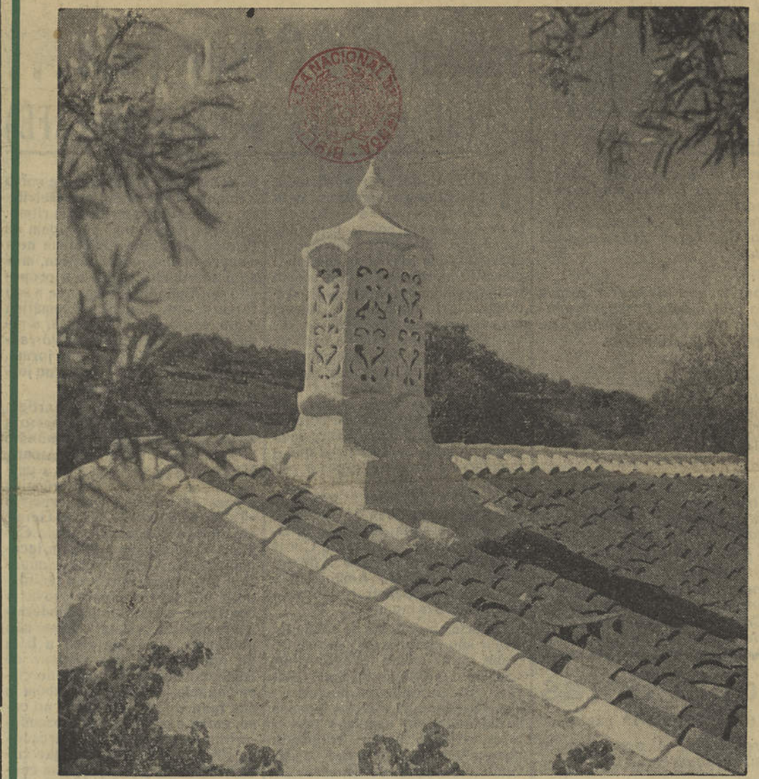
O Algarve, enorme jardim na orla Sul de Portugal, debruçado sobre o mar Atlântico, pátria de um povo alegre e vivo, pescador e marinheiro — tem um dos seus maiores encantos nas típicas e graciosas chaminés que se erguem sobre os telhados, por entre a folhagem das figueiras e amendoieiras, recortando o seu branco perfil de reminiscências mouriscas, no azul intenso do céu meridional.

E que lhe importa Lisboa que crónistas sem nome lhe ofendam o fado, o seu fado com cascas de