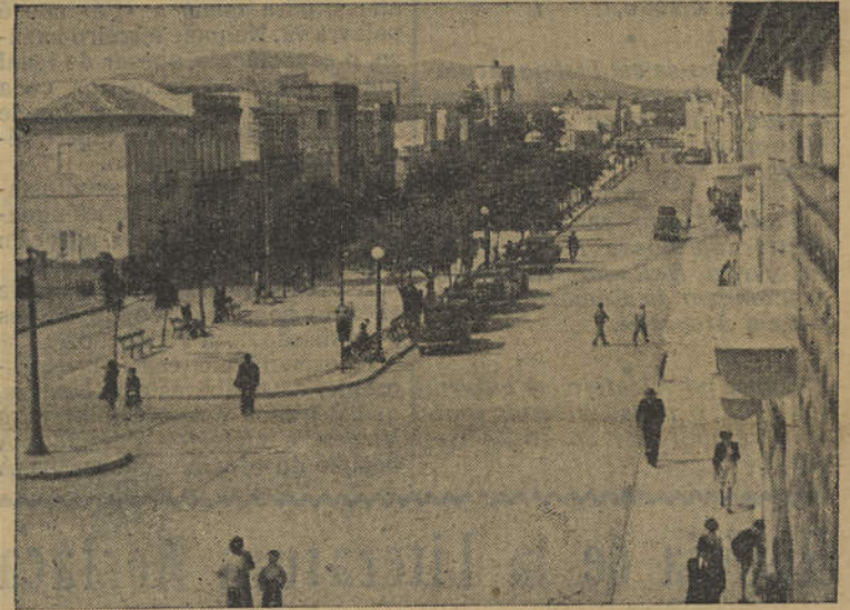
AVENIDA DA REPÚBLICA EM OLHÃO