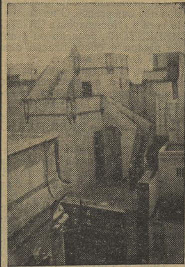
Um aspecto típico Olhanense

Na sua sempre crescente acção de minorar os males que tão abundantemente existem nos doentes pobres, a Comissão Municipal de Assistência da nossa vila, pede a todas as pessoas que possuem armações de óculos e que já não lhes sirvam, o favor de os entregar na Misericórdia, pois concorrem assim para beneficiar muitos pobres que delas necessitam, não só adultos como crianças.