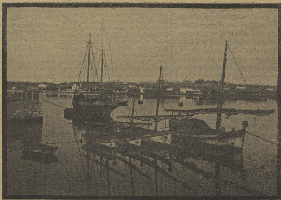
UM ASPECTO DO PORTO DE LAGOS

Esperamos que após o êxito tomado por este serviço de noticiário do Emissor Regional do Sul, a E. N. dê completa autonomia ao seu Emissor Regional algarvio.