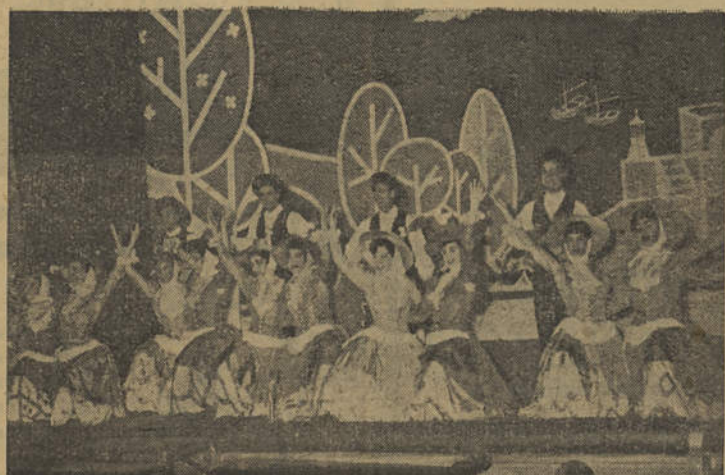
O «corridinho» algarvio em cena

Por decreto publicado no «Diário do Governo» autoriza a Direcção-Geral dos Edifícios e Monumentos Nacionais a celebrar contrato pela importância de 1.471.962$60, para execução da empreitada de construção da cadeia comarcã de Faro.