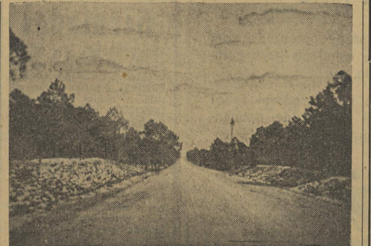
A MATA DA NOSSA VILA, LOCAL IDEAL PARA A CONSTRUÇÃO DE UMA «POUSADA DE JUVENTUDE».

Algumas pousadas possuem dormitórios separados, para rapazes e raparigas, uma sala comum que serve de cozinha e de recepção, e as mais luxuosas contam uma (Conclui na 4.ª página)