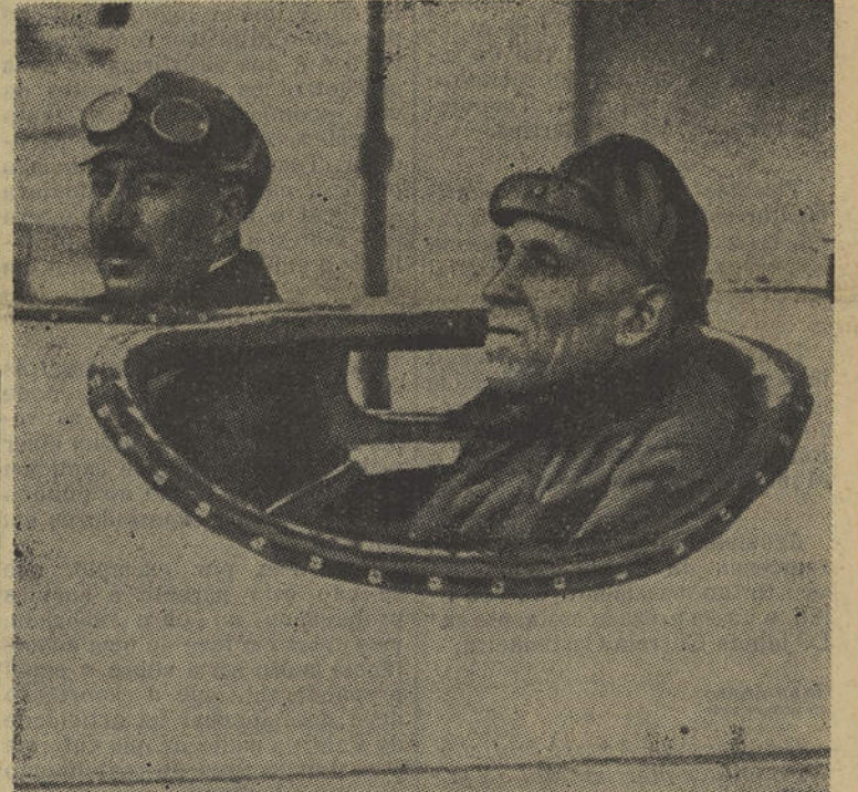
Uma fotografia histórica: Sacadura Cabral e Gago Coutinho no momento da partida para a sua gloriosa viagem.